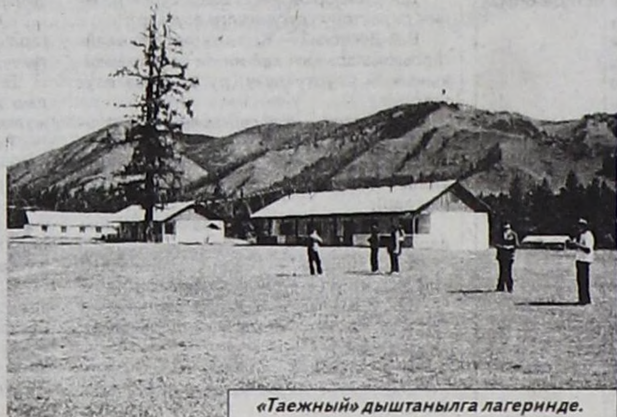
«Таежный» дыштанылга лагеринде.