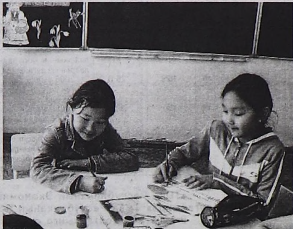
Кызылдың № 1 ортумак школазының чанында хүндүскү лагерьде уруглар.