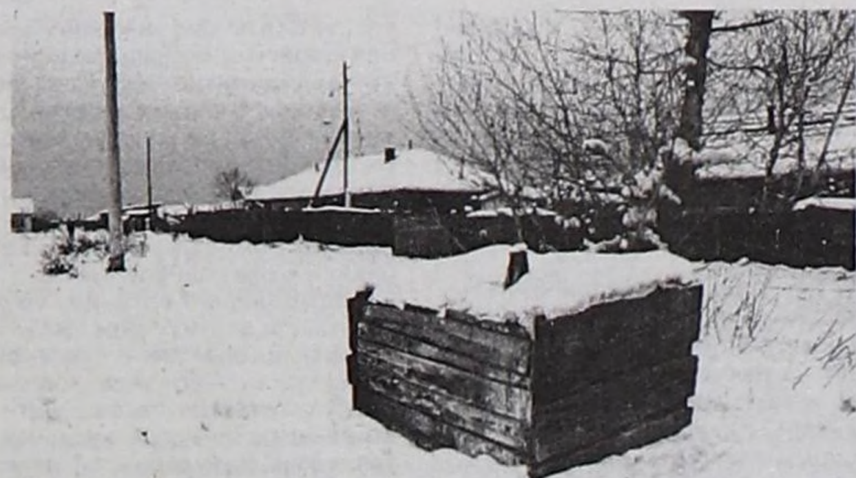
Чурук № 1

«Шын» солун редакциясына Кызыл хоорайның даштыг хавак кырында Мира болгаш Складская кудумчунун бөлүк чурттачылары келген. Оларның тургузуп келген айтыры ижер суг айтыры бергедээн деп турар. Республиканың найысылалы Кызыл хоорайга чурттап олургаш, ижер суг айтыры бергедээн дээрке кайыын боор дээш, ону барып көөрү-биле солунун ажилдакчылары, айтырыг тургузуп келген хамаатыларны эдертип алгаш чоруптувус.