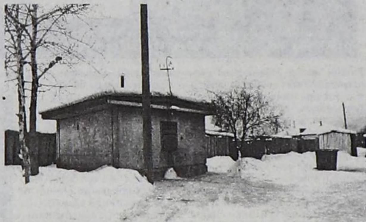
Чурук № 3

Хавак кырының чамдык чер бажыңнарында казып каан кудуктарлыг улустар база бар. Ол кудуктарның ханызы 20 ажыг метр. Кыжын ол кудуктарның суу