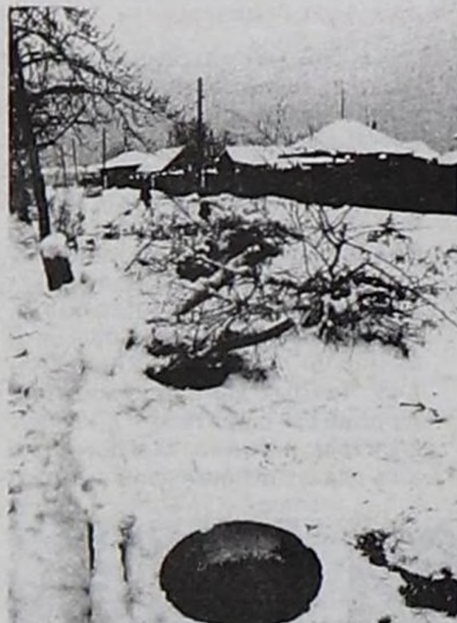
Чурук № 2

Бо материал парлалга үнүп кээрге, кандыг чүү-даа болза, кижинин кадыйына хоралыг-даа чурттачы чоннуң эң сөөлүг амьдырап турган, чылыг суг ап турган люгун хаап кааптар болза, халап болур эвеспе деп-даа чурттачылар чугаалап турдулар.