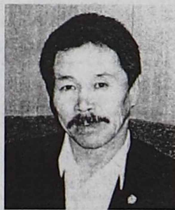
Ол езугаар геоэкология талазы-биле эртем-шинчилел ажилдарының камгалаашкынын

— Университеттин аспирантыларының, ол ышкаш өске-даа дээди өөредилге черлериниң аспирантураларында өөренип турар ТывКУ-нуң башкыларының өөредилгезин харылап турар аспирантураның үре-түнелдин көскүзү-биле бедээн. Университетте аспирантурага эрткен чылын «Хоойлу-дүрүмнүң болгаш күрүнениң теориязы болгаш төөгүзү. Хоойлу-дүрүм өөредилгезиниң төөгүзү» болгаш «Культураның теориязы болгаш төөгүзү» деп ийи чаа мергежилди ажытывыс. Бо талазы-биле шинчилел