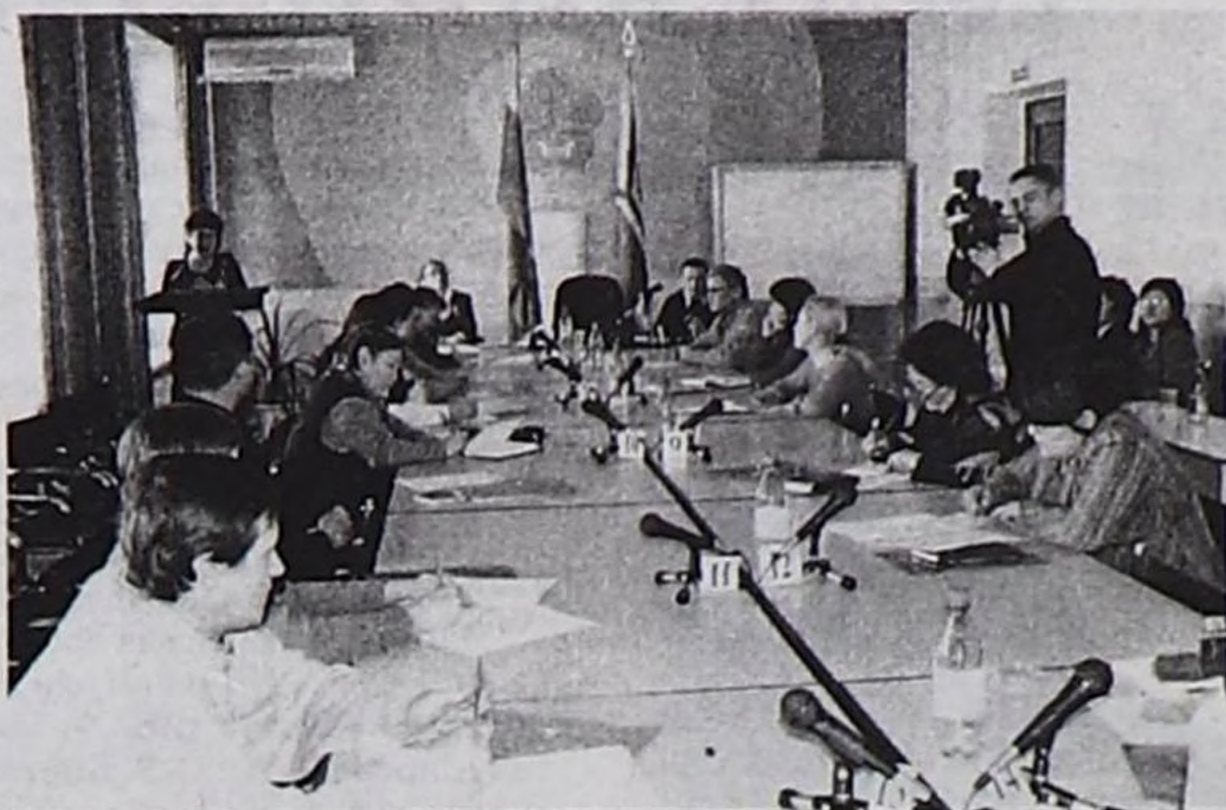
Семинарның киржикчилери.

Февраль 20-ден март 9-ка чедир суртаал ажылы үргүлчүлээр. Чазак бажынының хурал-