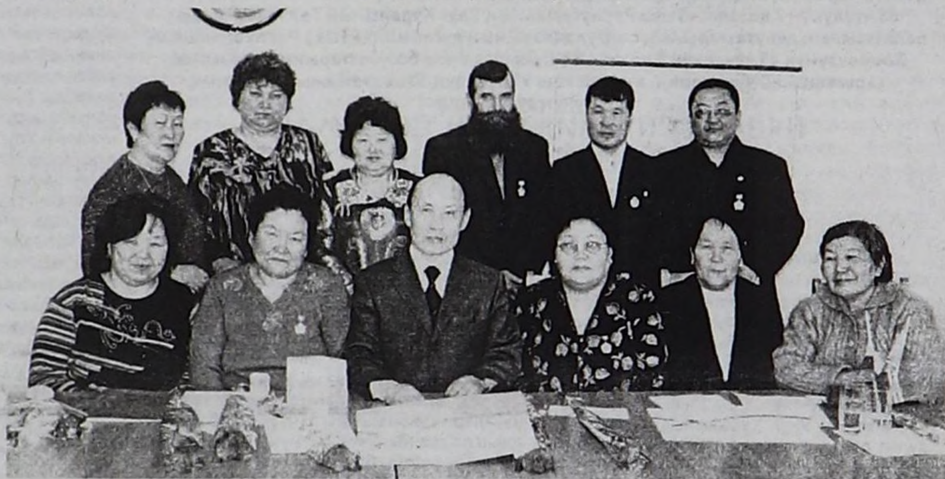
Шаңнаткан бөлүк мурнакчылар.

Шаңнаткан күш-ажылдың мурнакчыларынга кел чыдар Шагаа-биле күш-ажылчы чедиинкин-