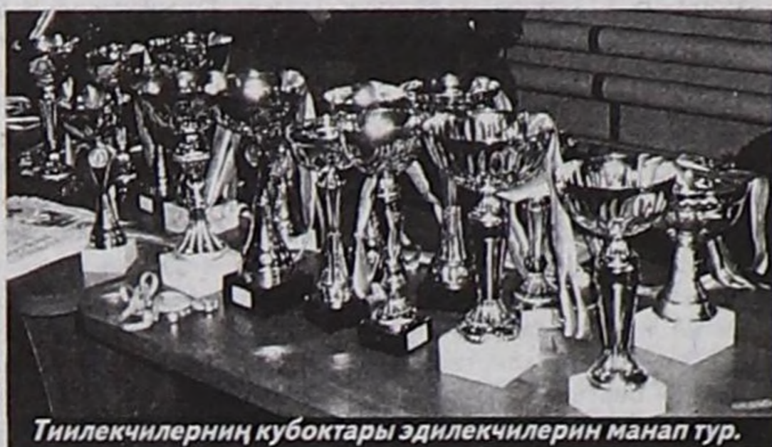
Тиелекчилерниң кубоктары эдилекчилерин манап тур.

Тыва Республиканың Каратэ федерациязы Кызылда И.Ярыгин атыг спорт комплексе хоорайның өөреникчилериниң аразына «Аныктар наркотиктерге удур» деп шилилге маргылдааны февраль 10-да эрттирген. Бо маргылдааның тиелекчилери болган уруглар Сибирь федералдыг округтуң Саяногорск хоорайга бо чылдың март 10-да эртер чемпионадынга киржир эргени чаалап алган.