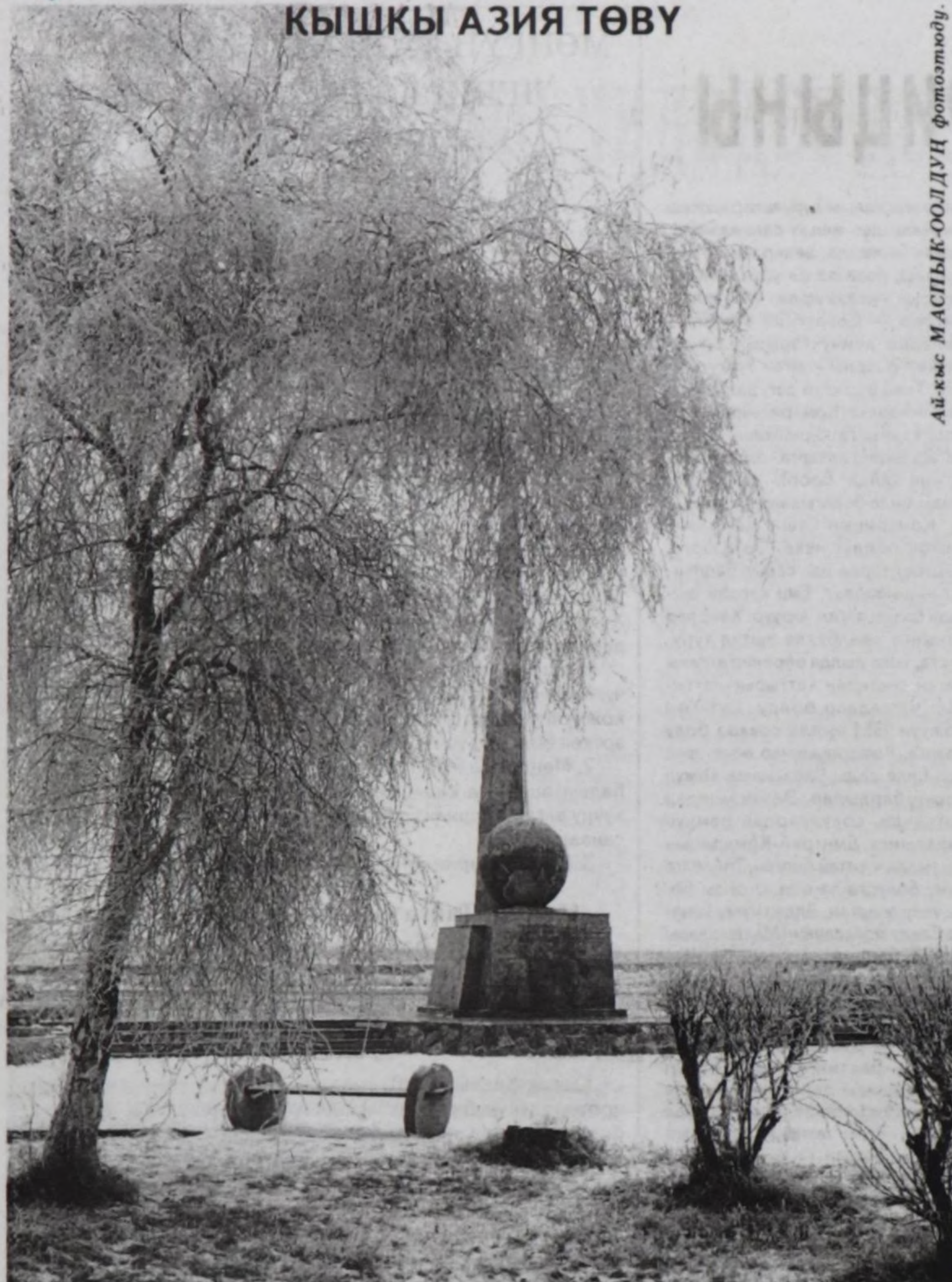
Ай-кыс МАСПЫК-ООЛДУҢ ФОТОСҮМӨДҮ.

Каа-Хем биле Би-Хемнің белдиринде Каас-чараш Улуг-Хемнің эринде Азияның төвү тураскаалдан Аалчылар кыжын, чайын үзүлбес.