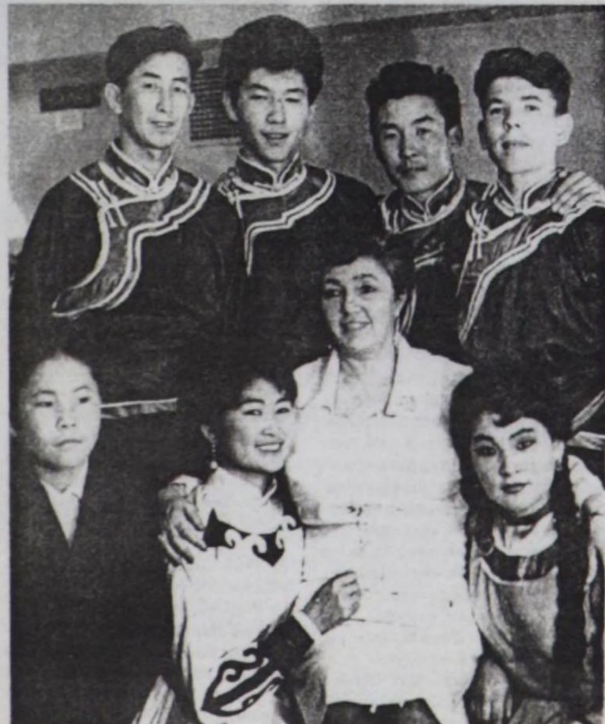
Совет Тываның 20 чыл оюнда Москва хоорай, Кремльдин театрында.