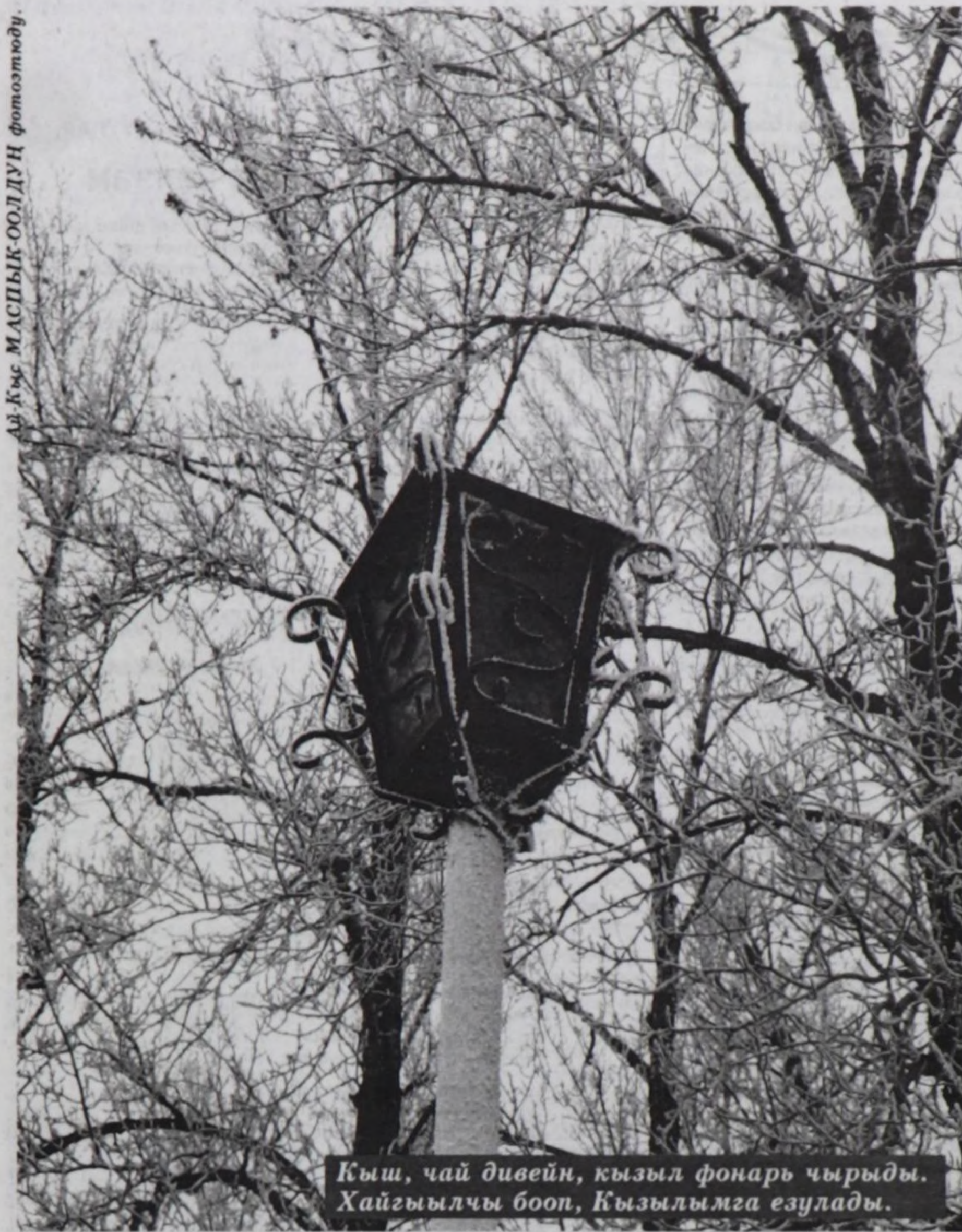
Кыш, чай дивейн, кызыл фонарь чырыды. Хайгыылчы бооп, Кызылымга езулады.