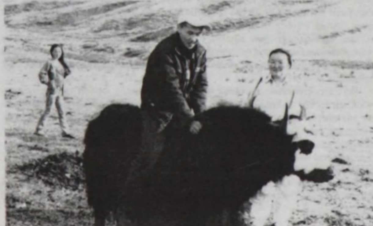
Дартагы сарлыкчыны бөгүн кижизидер.

Чугааны уламчылаары-биле: — Юбилейин демдеглээн улуста кандыг чидиг айтырыглар турар боор, тамчыктыг олур силер ийи-ле? – деп баштактандым.