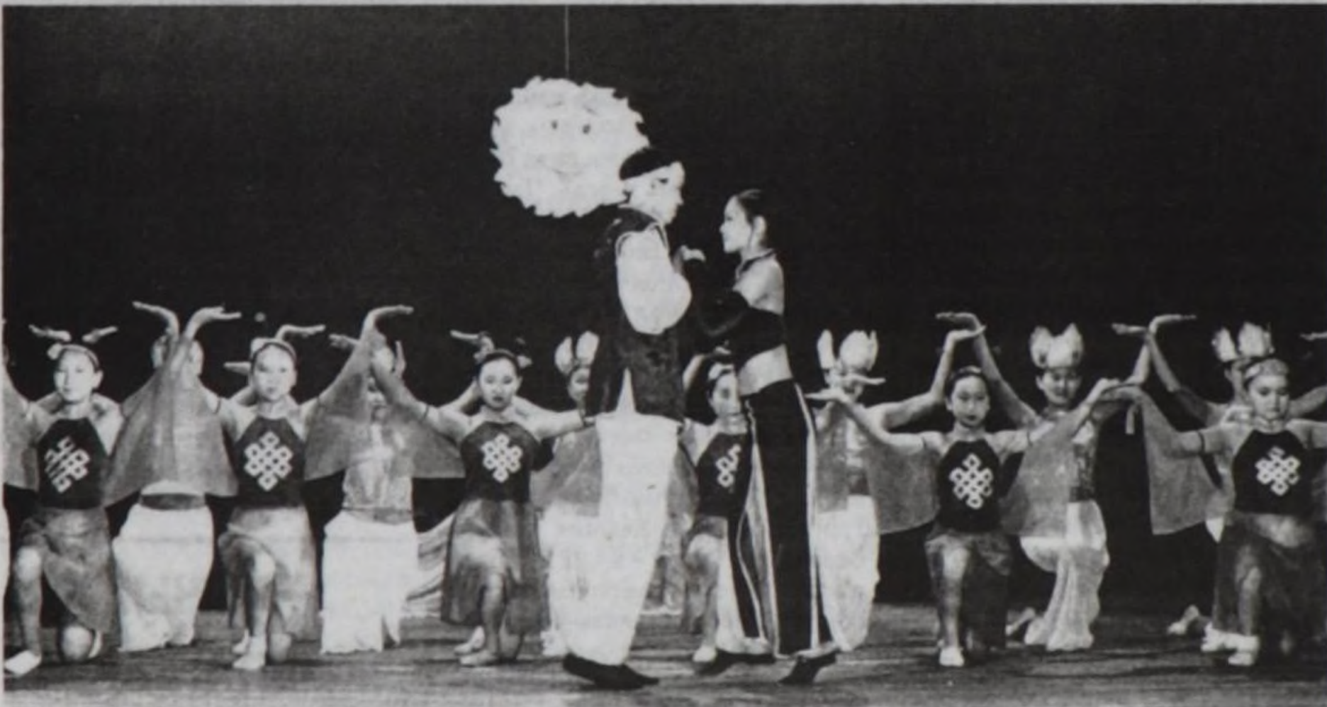
Ак-довуракчылар ойнап-даа, самнап-даа билерлер...

Бир хүн иштинде уламчылаан конкурса кожууннар шаа-биле эки белеткенгени илерээн. Чижээ, Тес-Хем кожуунуң Чыргаланды ортумак школазының уруглар театры А.Толстойнуң «Моортай болгаш дилги» деп шиизин орус дылга ойнаан. Бо театрның тургусканы