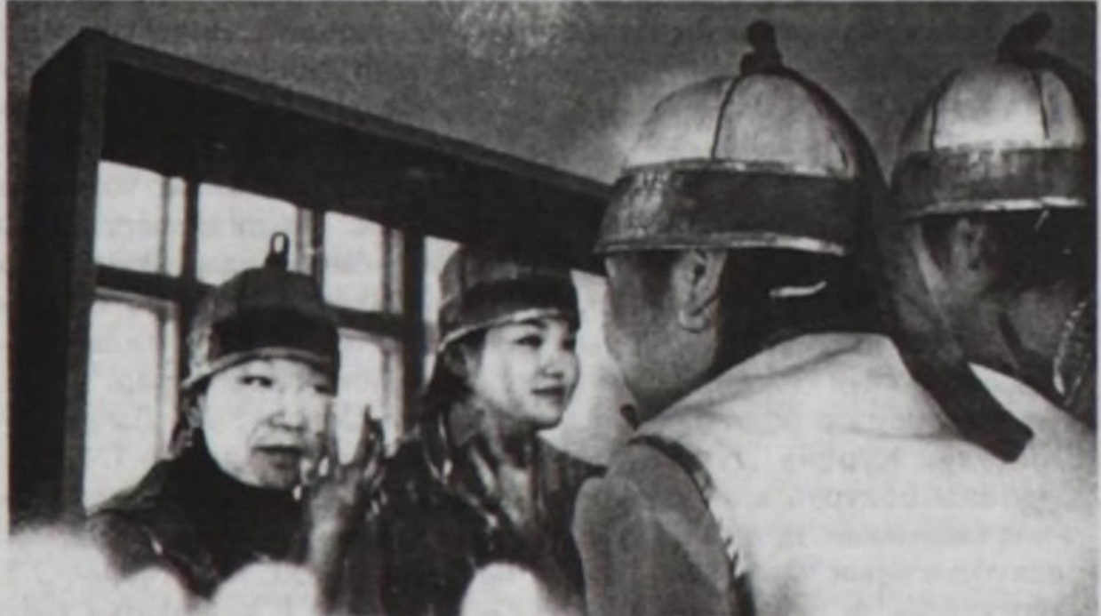
Улуг-Хемниң аныяк артистери сценаже цнеринге белеткенип тур.