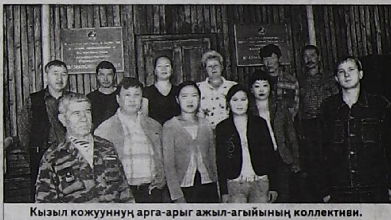
Кызыл кожуунуң арга-арыг ажил-агыйының коллективи.

—Ийе, бистиң арга-арыг ажил-агыйы тургустунгандан бээр бо чылын 40 харлаан. Ынчангаш юбилейлиг чылда удуртур-баш-