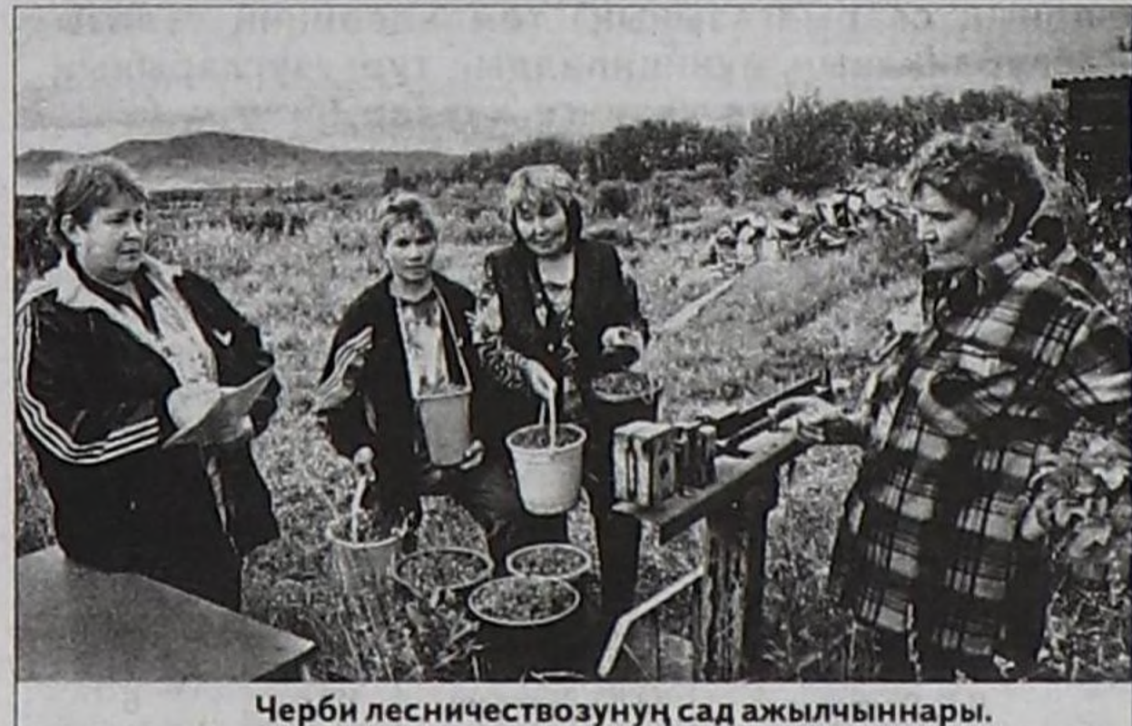
Черби лесничествозунуң сад ажилчынары.

Тыва Республиканың Чазаның болгаш Арга-арыг агентилелиниң