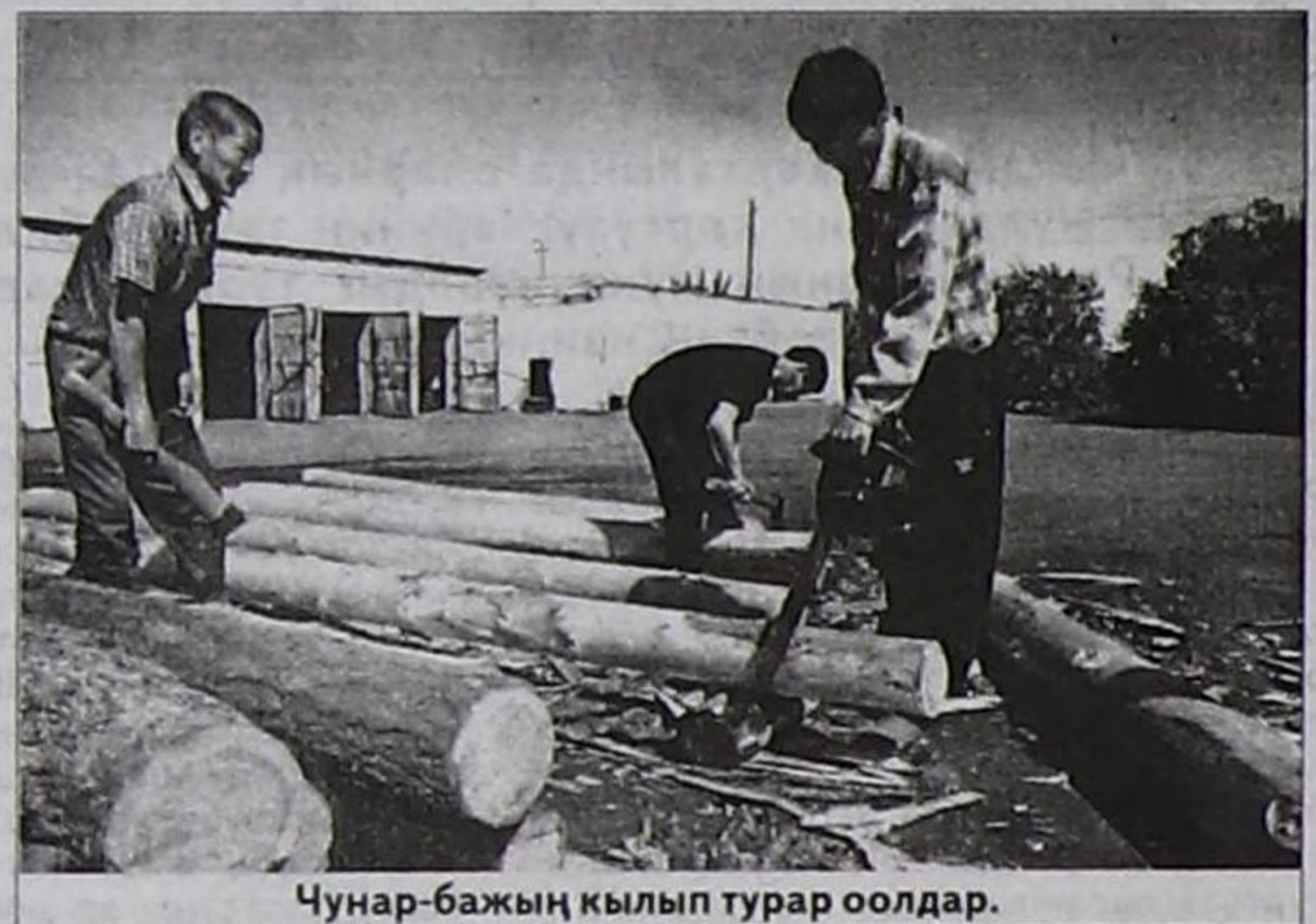
Чунар-бажың кылып турар оолдар.

болгаш кам-хайыра чок аажылалдан кадагалаар. Чонга ажыктыг кылдыр ажылгалга ыяш кезер, тудуг материалдары белеткээр, дузалал ажил-агыйларын сайзырадыры-биле кылып чорудуп турар ажилдарга документилерни долдуруп турар. Бо бүгү ажилдарны арга-арыг инженерлери, мастерлер, лесничийлер харылаар. Оон аңгыда олар харылап турары девискээрлерин үргүлчү контрольдап, тегерип көөр ажилдарны