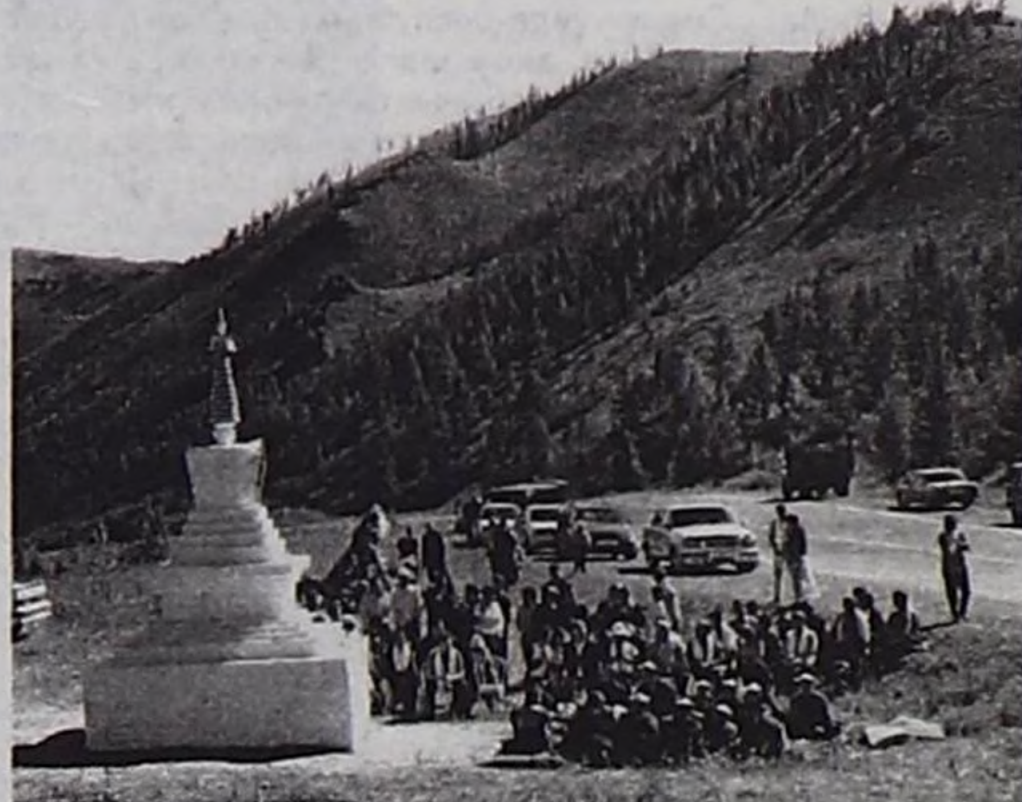
Сувурган ажыдышкынының үезинде Камбы-лама эргелелиниң хуурактары ном номчаан.

Магалыын, мындыг аныяк улус тыва чону, оон келир үеде сагыш салып, чүнү-даа харамнанмай, улуг Россия-биле бистиң республикавысты харылаштырып турар чоннуң улуг оруунда сувурган тудуп