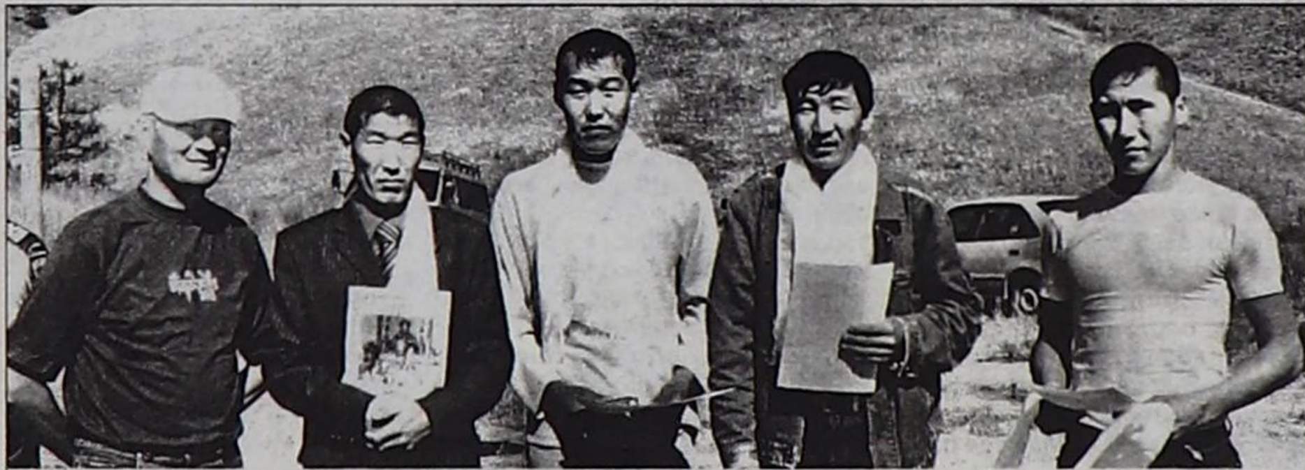
Камбы-лама эргелелиниң хөндүлөл бижиктеринге төлептиг болган бөлүк тудугжулар.