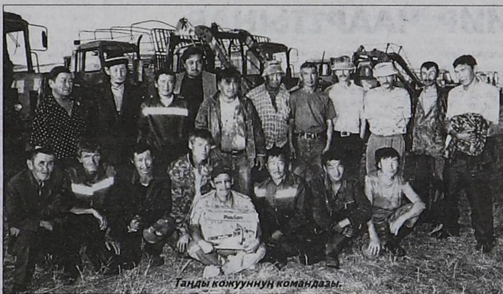
Таңды кожуунуң командасы.

Тиелекчилерге болгаш аалчыларга Таңды кожуунуң культура уран чүүлүнүң мастерлери кончуг чараш ырыларлыг, танцы-самныг концертин көргүскөн. Каң-оол САТ. Василий БАЛЧЫЙ-ООЛДУҢ тырттырган чуруктары.