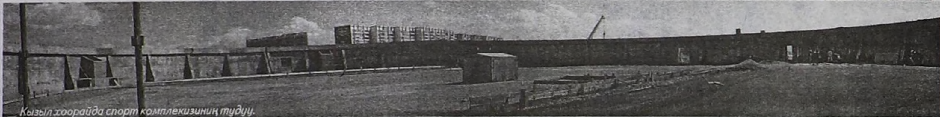
Кызыл хоорайда спорт комплекзиниң тудуу.