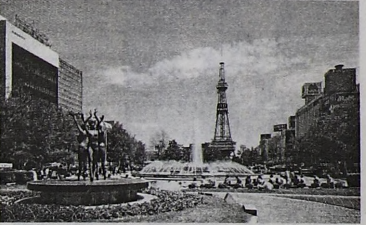
Саппороңуң төп кудумчузу Одори.

бирээзи. Үстүнде адаанывыс Ботаниктиг садтан аңгыда 15 парк база бар. Парк бүрүзү бот-тарыннан ылгалдыг. Чижээлээрге, Хадыңныг парк бар. Ында чүгле хадыңнар тараан. Даштар парыгы,