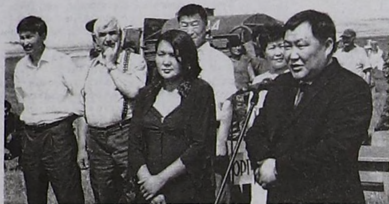
Чазак Даргазы Ш.В. Кара-оолдуң конкурс киржикчилеринге байыр чедирнишкени.

Дүрген суму чагыргазының даргазы Ю.Б.Оюн келген кожууннар төлөөлөрүнөн рапорттарны хүлээп алгаш, ТР-ниң Чазак Даргазы Шолбан Кара-оолга илеткэн. Илеткелден билдингени болза, маргылдаага киржири-биле 8 кожуун: Каа-Хем, Улуг-Хем, Таңды, Чеди-Хөл, Чаа-Хөл, Сүт-Хөл, Бай-Тайга, Өвүрдөн 35 кижиге келген: трактор-биле сиден кезеринге — 15, хол-биле сиден кезер-20 сангы көдээ ишчилер. Маааа демдеглескен чүүл чүл дизе, Таңды кожуун чагыргазының даргазы С.Ч.Ондар бо хире улуг масштабты маргылдааны бир-ле дугаар организастан турар-даа болза, шупту белеткел ажылдарын чогумчалыг чорутканын онзаласкадым. Машина-трактор, келген аалчыларның чөмөнчилге, оларга таарымчалыг байдалдар, безин кожуун бүрүзүнүң чыскаалга ту-