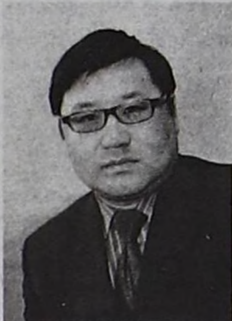
Каң-оол Тимурович ДАВАА, Тыва Республиканың күш-ажыл болгаш социал политика сайыды

Бай-Тайга районун Тээли суурга 1967 чылдың декабрь 24-те төрүттүнген. Дээди эртемниг. 1992 чылда Красноярскиниң күрүне университетин, 2006 чылда РФ-тин Президентизиниң чанында Россияның күрүне албанының академиязын дооскан. Саң-хөө адырынга 10 ажыг чыл удуртур албан-дужаалдарга ажылдаан. Сайытка томуйладырынга чедир Тыва Республиканың Саң-хөө яамызының күрүне садып алышкын департаментизин удуртуп турган.