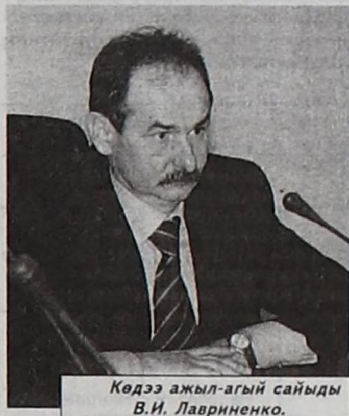
Көдээ ажил-агый сайыды В.И. Лавриненко.

Январь 25-те Чазак Бажыңының хуралдаар залына хоорайларның, кожууннарның болгаш сумуларның чагырга даргалары, Тыва Республиканың Чазаның хоорайларда болгаш кожууннарда девискээр эргелелдериниң удуртукчулары, көдээ ажил-агый эргелелдериниң начальниктери, көдээ ажил-агыйның болгаш болбаазырадыр бүдүрүлгелерниң удуртукчулары, арат-тараачын (фермер), хуу дузалал ажил-агыйларның болгаш Тыва Республиканың Хереклекчилер эвилелиниң төлээлери, суму чагырга даргалары дээш, республиканың көдээ ажил-агыйга хамаарылгалыг бүгү удуртукчуларының киржилге-биле «Агроүлетпүр комплекзин хөгжүдери» мурнады көргөн национал төлевилелдин 2006 чылда боттанышкынының түңнелдериниң дугайында болгаш 2007 чылда сорулгаларының айтырыгларының талазы-биле семинар-хурал болган. Хуралды Тыва Республиканың көдээ ажил-агый сайыды В.И. Лавриненко башкарып эрттирген.