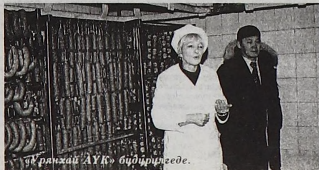
«Урянхай АҮК» бидирилгедө.

хаара туттунганнар база бар-ла болгай. Бөгүн мында келген көдээ ишчилерниң удуртукчулары чаа үениң дериг-херекселдерин чүгле көөр звес, а бүдүрүлгениң күчүзүн, чеже-даа этти хүлээп алыр арга-шинекти биле таныжып көргөш, дугуржулга-керээлери чарып ап болурлар. Көдээ ажил-агыйның бараан бүдүрүкчүлери ырады чоруп турбас кылдыр бо чылын бүдүрүлгениң мал согар салбырларын барыын болгаш төп кожууннарда аждаарын көрүп турар бис. Амдызында бо чылын 8 ындыг черлерни аждаар бис. Бөгүн малчын кижжи чүгле бараан бүдүрер звес, а оозун сайгарар база-ла болгай. Ынчангаш ук салбырларга олар бүдүргөн барааның дужаары эпиг болур.