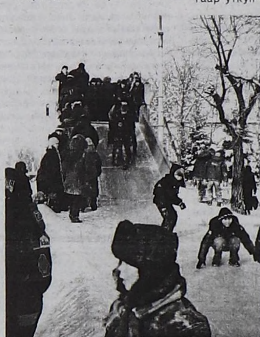
...Чуңгувустуң чылгырын көр!