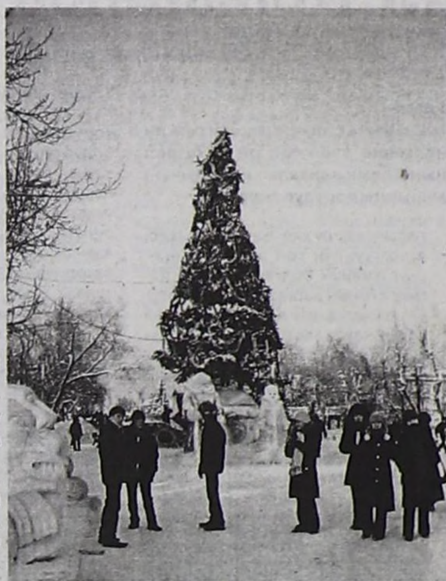
«Чаа чылдың Елказы — Чалыыларның чыгыр чери...»

— Чаа чыл-биле, аныяктар! «Шын» солун байыр чедирип тур! Чартык шак бурунгаар уткуп алган