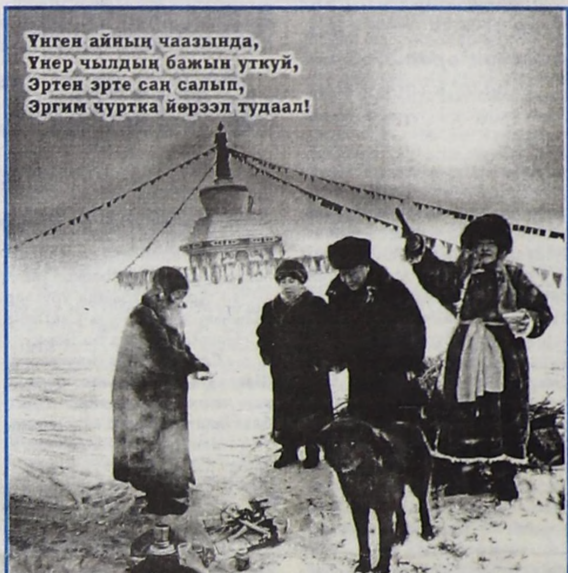
Үнген айның чаазында, Үнер чылдың бажын уткуй, Эртен эрте саң салып, Эргим чуртка йөрээл тудуал!

Бүгү эргим тыва чонумга аас-кежиктиг болурун күзедим! Хүндүткел-биле, геше Лобсан ТҮПТЕН.