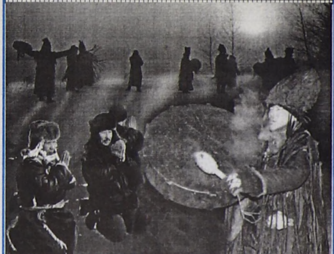
Каң кадыкшылды, каткы-хөгү, Кайгамчык чедишкннини Хайырлаңар, Өршээ!