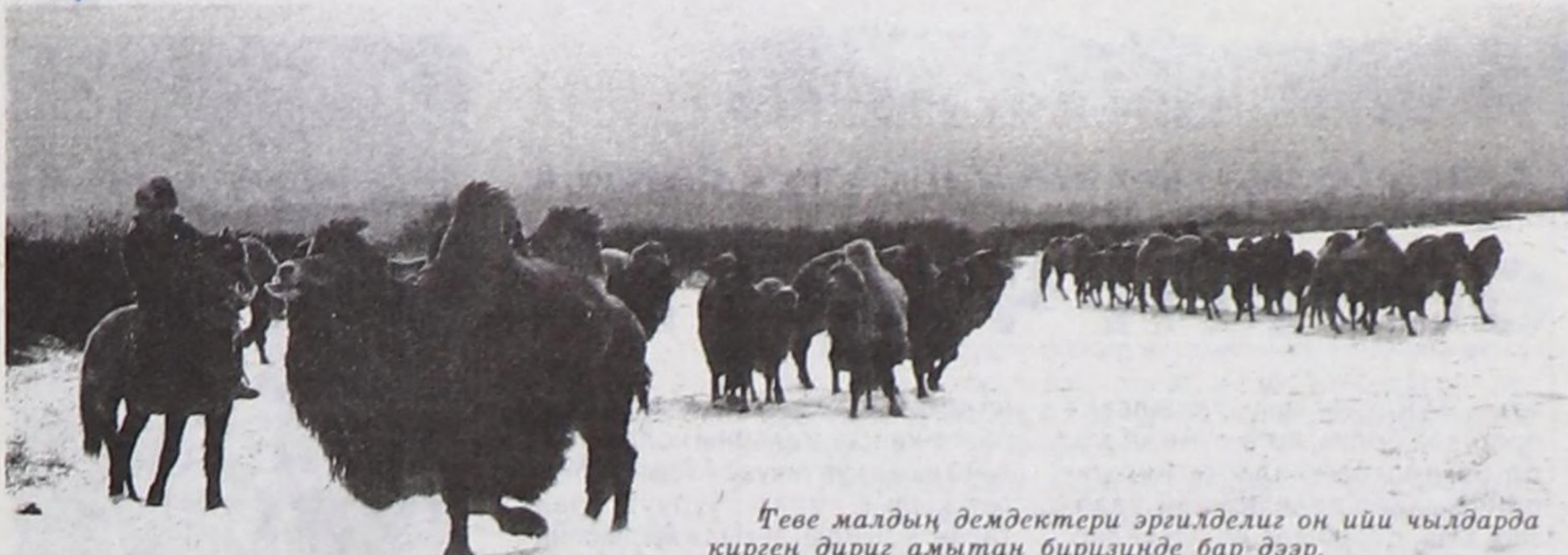
Теве малдың демдектери эргилделгиз он ийи чылдарда кирген дириг амытан бирүзүнде бар дээр.