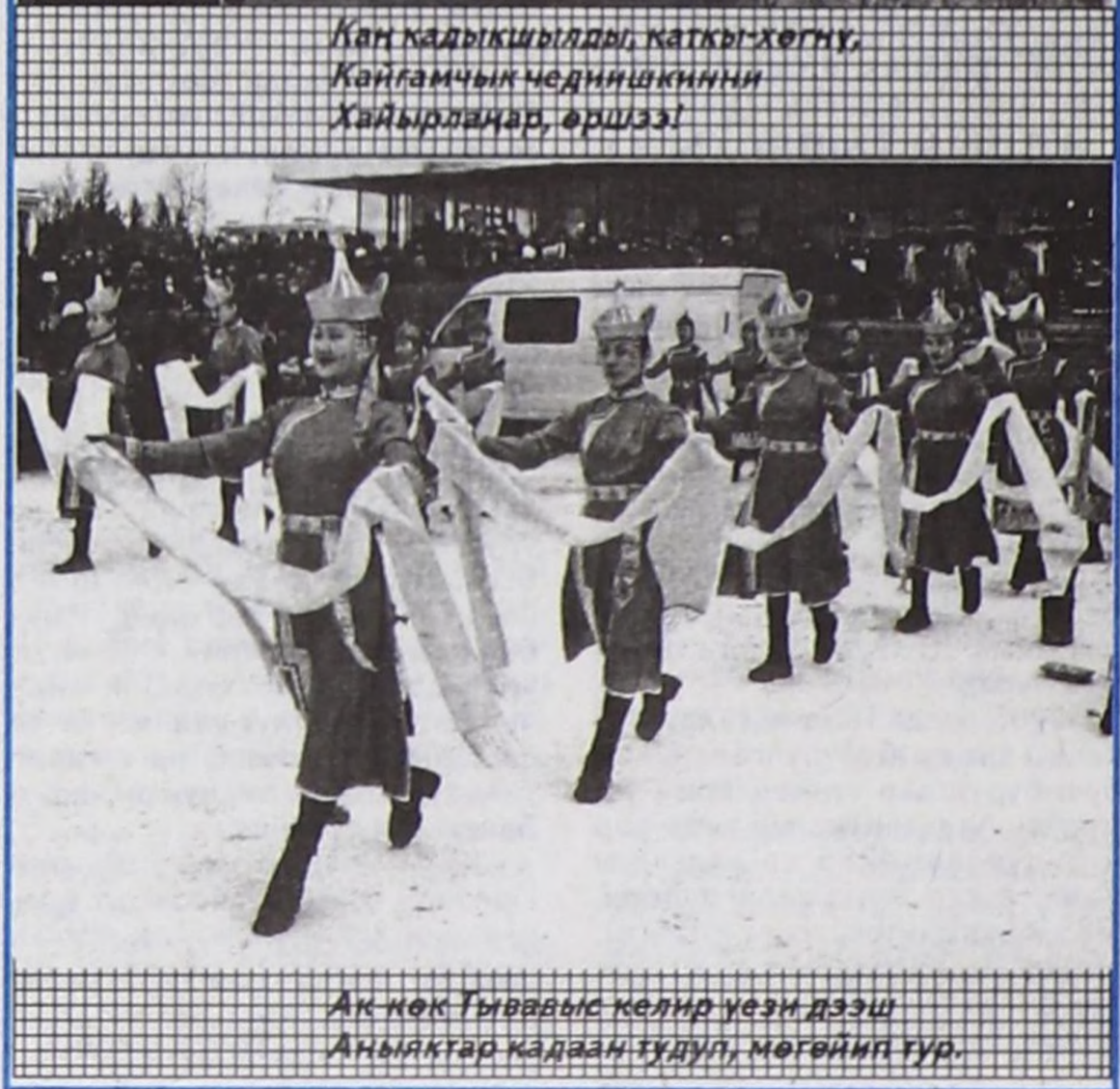
Ак көк Тывавыс келир үези дээш Аныяктар кадаан тудуп, мөгөйип тур.