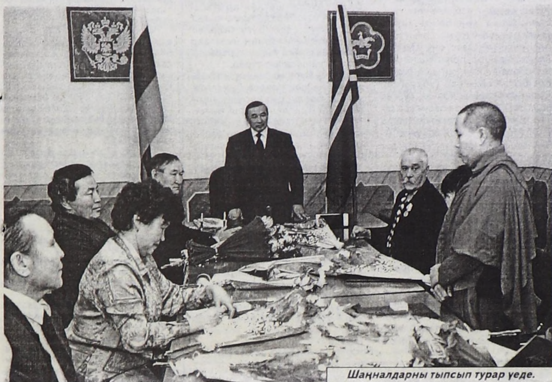
Шаңналдарны тыпсып турар үеде.

Тыва Республиканың Чазак Даргазы Ш.Д. Ооржак Тыва Республиканың күрүне шаңналдарын күүсекчи болгаш төлээлекчи эрге-чагырга органнарының, парлалганың массалык чепсектериниң, шажынның бөлүк ажылдакчыларына Чазак Бажыңына январь 19-та байырлыг байдалга тывыскан.