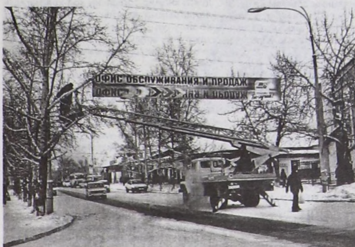
Чарлал-рекламаны азып тур.