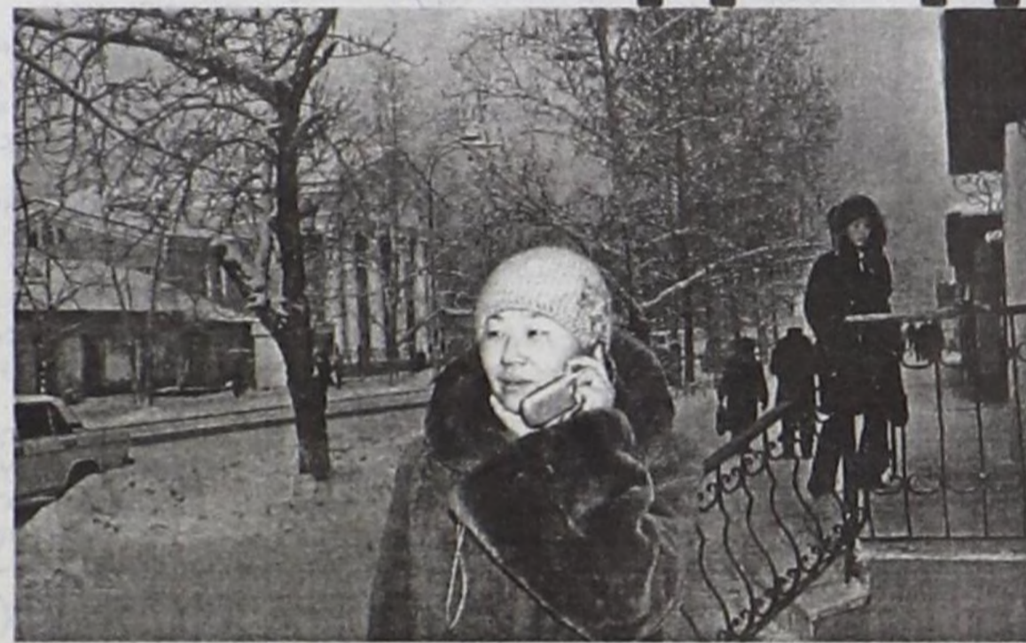
Каяа-даа чорааш долгаптар арга бар.

Оларның кол кылып турар ажылы – мобильдиг азы соттук телефон садып алган кижилерге «Sim-карта» (симкарта кылдыр номчуур) сүп бээри. Чогум ол «Sim-картаны» телефонче сүп бээри халас, садып алыкчы чүгле ук мобильдиг харылзааны ажыглап чугаалашкан үезин төлээр. Чижээлээрге, садып алыкчының төлээни 5 долларны (150 рубль) ооң мобильдиг телефонунда «Sim-картазынче» тускай специалист сүп бээр. 5 долларның харылзажыр ортумаак үези 50 минута. Оон хөй чугаалажып, дүргени-биле чарыгдап азы эвээш, хүнде 2-3 минута чугаалажып, бир ай чедир камнап-даа ап болур. Садып алыкчы күзээр болза, 5-тен хөй 6,7, 8, 9, 10-даа долларны «Sim-картазынче» суктуруп ап болур. «Sim-картаны» мобильдиг телефонга тускай специалист чаңгыс катап салып бээр, ооң соонда доллары төне бээр-ле, садып алыкчы өртээн төлээш, «Sim-картазынче» чаа долларларны суктуруп аар. Мобильдиг харылзаа сагыш дег дүрген, эптиг,