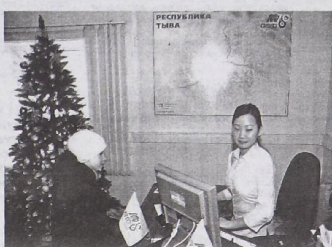
Садып алыкчыны хүлээп ап турары.