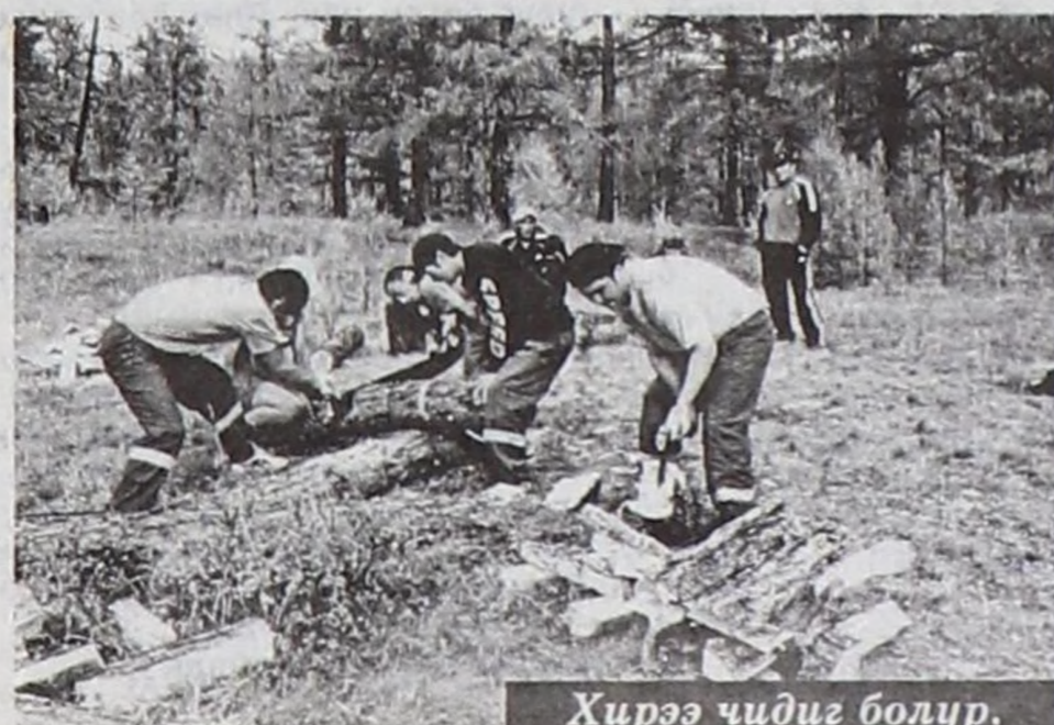
Хирээ чидиг болур.