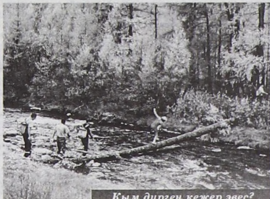
Кым дүргөн кезер эвес?