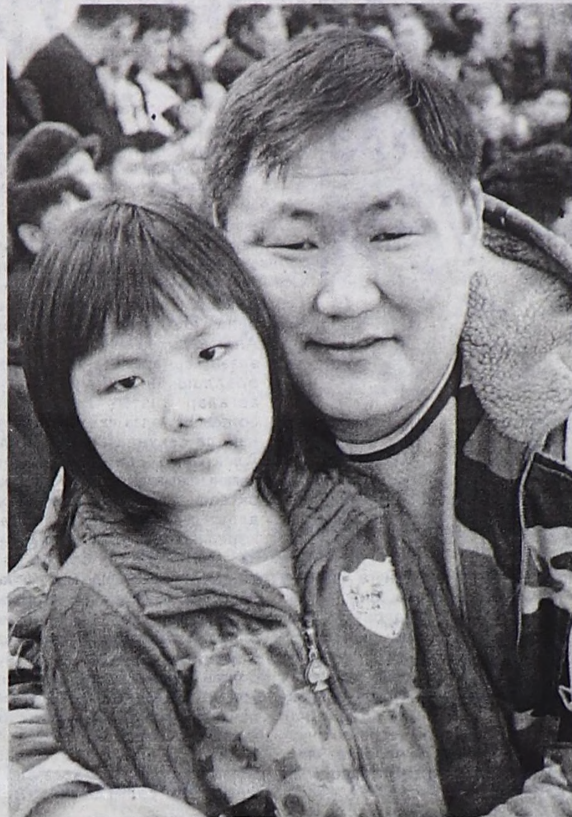
биле сайгарып тургаш, ооң соонда чүү болурун сайгарып тургаш, бадылаар болза эки. Ажы-төлдеривиске кандыг келир үени тургузуп берип турар бис деп чүвени бодаар болзувусса эки. Моон соңгаар частырыг кылыр эрге бисте чок.

Бо бүгү чүгле бистиң шупту-устан хамааржыр. Ам бистиң кандыг орук шилип аарывыстан хамааржыр. Биске кандыг-бир партия, кандидат, политик эки бооп болур азы эки эвес бооп болур, ынчангаш бадылаарда чүгле чүрек-биле эвес, а угаан-