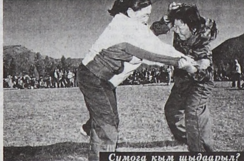
Сумога кым шыдаарыл?