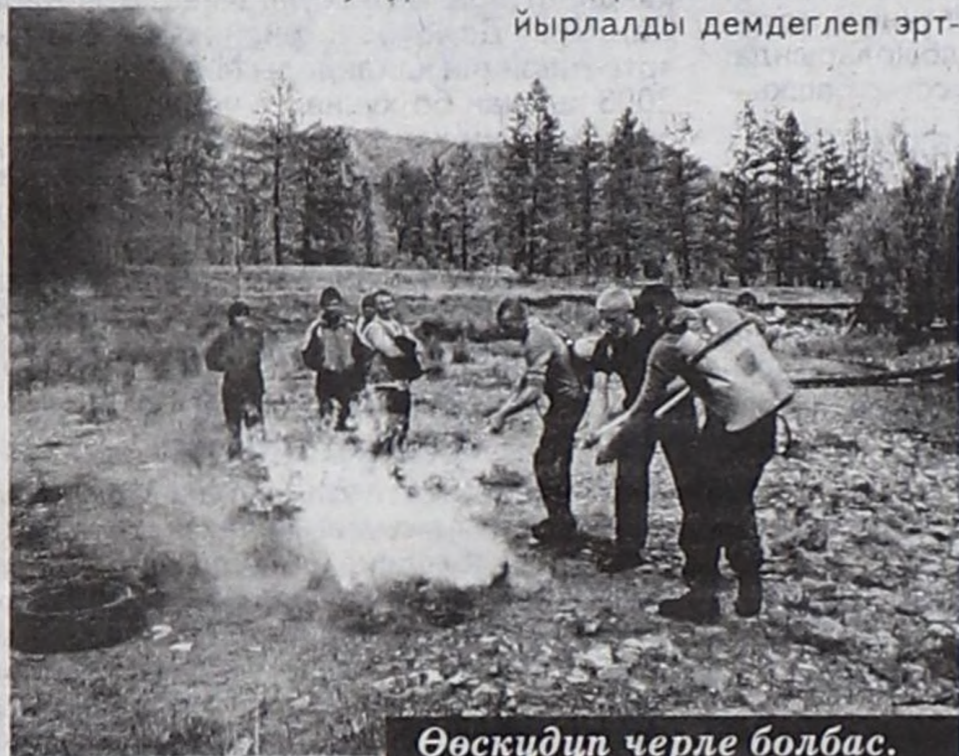
Өвсүдүп черле болбас.