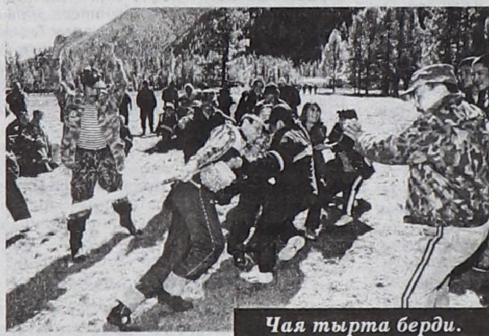
Чая тырта берди.