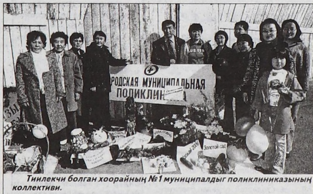
Тиелекчи болган хоорайның №1 муниципалдыг поликлиниказының коллективтери.

сонуурган эргиер дээр болза, чартык хүннүң ажылы. Ынчангаш каксы дөгезин эргидивис.