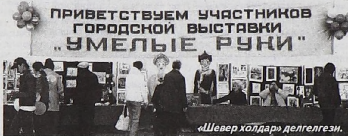
«Шевер холдар» делгелгези.

Найысылалдың албан организация, бүдүрүлгелериниң болгаш өөредилге албан черлериниң коллективтери аңаа идепкейли-биле киришкен. Чаңыл болган чылдың-на эртип турар байырларда да доктаамал киржи турар коллективтерни кижичи дораан эскерип, оларның ажылы, уран кылыглары чылдан чылче көвүдөп, шынары бедип оранын магадаар. Бо удаада база ындыг болду. Делгезин чүүлдерни кудумчунун аайы-биле (ийи талазында) делгеп бады келген, ооң шуптузун тавар