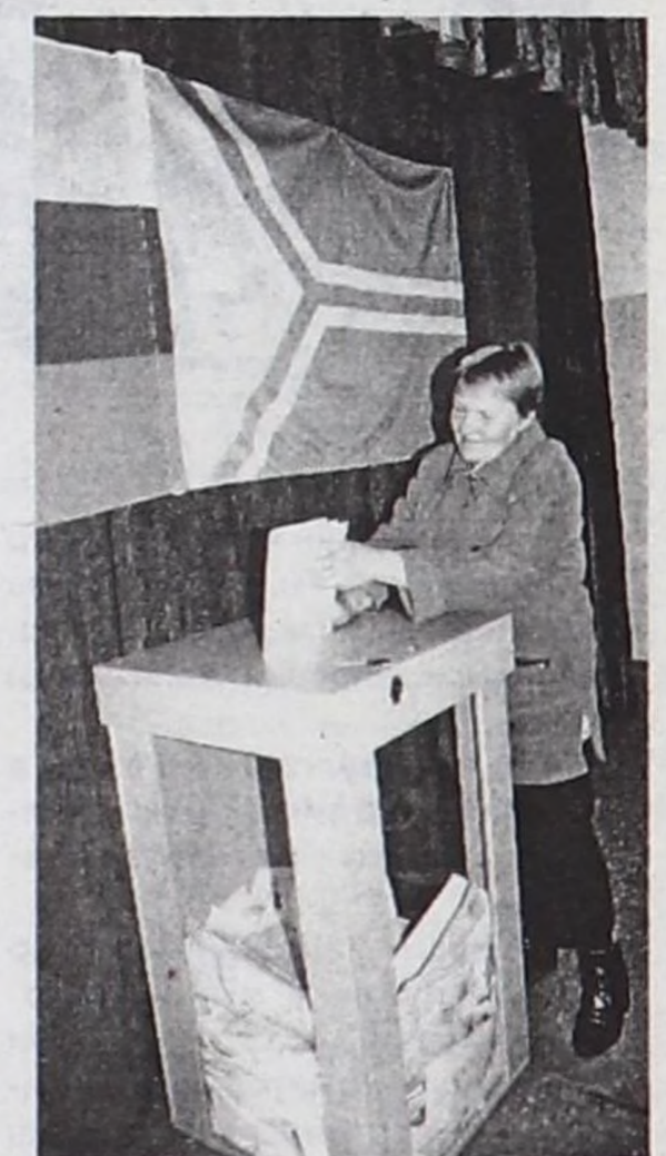
даа кылып кагбас» деп сарыг баштыг херээжен кижги химиренди.

№12 соңгулда участогунга кежээликтей 6 шак үезинде чедип чорувуста, чаа соңгаан хевирлиг, студентилер-ле турган боор, чаа бадылаан ийи оол, ийи кыс эртип