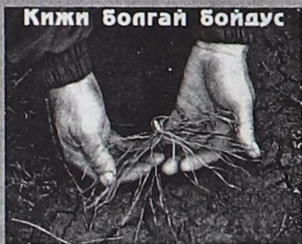
Кижн болгай бойдус