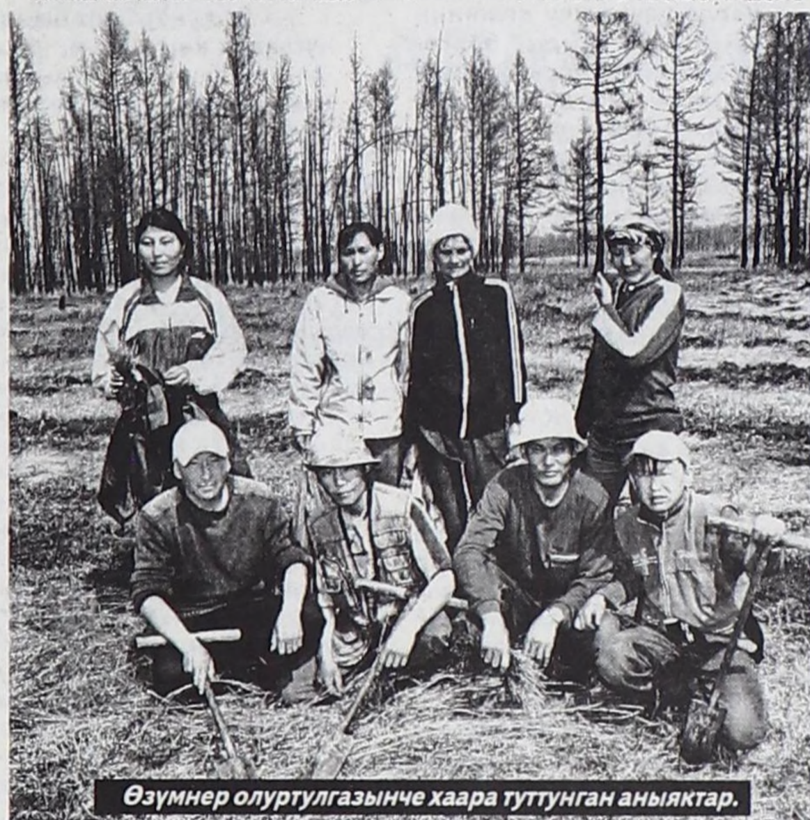
Өзүмнер олуртулгасынче хаара туттунган аныктар.

теп каар чүве-дир. Олурткан өзүмнерниң 80 хире хузу үнүп кээр, артканнары янзы-бүрү чылдагааннар уржуундан үнмейн баарын инспектор чугаалады.