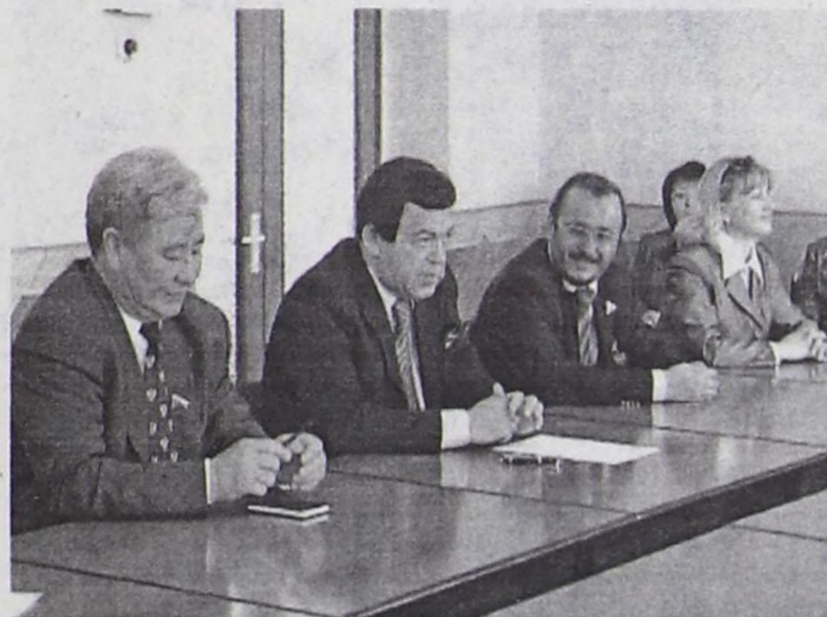
(Төнчүзү. Эгези 1-ги арында).

Амгы үеде биче сайгарлыкчы чорук республикада шапкын хөгжүп орар, чединмес амыдыралды дүргөн ажып эртериниң хемчеглери алдынган, республиканың, кожууннарнын, суурларнын социал экономиказын хөгжүдөр программаларын ажылдап кылып турар. №122 болгаш 131 Федералдыг хоойлулар республикада күүсеттинип турар, ындыг-даа болза оларны амыдыралга боттандырынгга таваржып турар чамдык