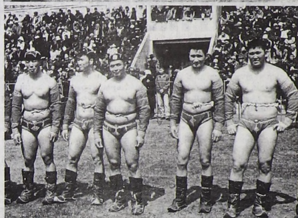
Солагай талазында моол аалчыларывыстың үш мөгези.

Мерген Ооржакты, Күзечи Куулар Тес-Хемниң Хүреш Сүктөрни тиелзэн.