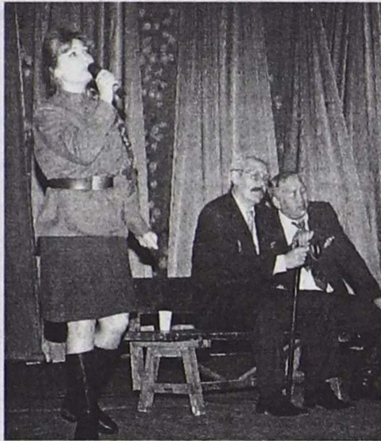
Концерт үезинде артистер.

тарын тургустунарының үези база болган. Тыва Республиканың Улуг Хуралының күштүг ийи палатазы, Тыва Республиканың Конституция суду, Саналга палатазы, чаргы ча-