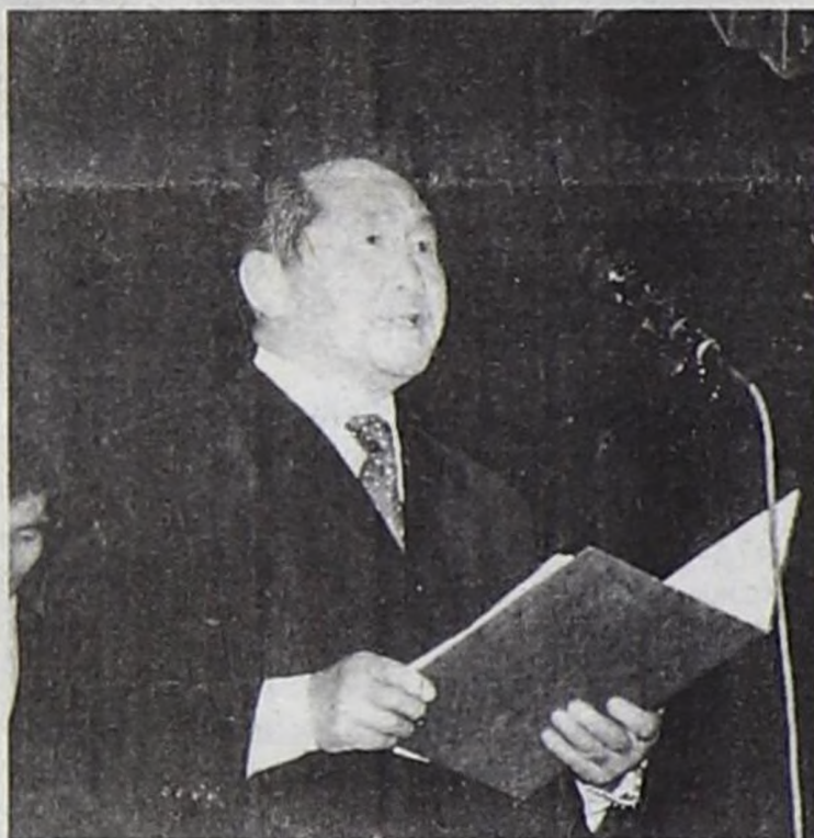
О.Л.С.Салчак — Тыва Республиканың Конституция судунуң даргазы.

Тыва Республиканың Конституция судунуң даргазы О.Л.С.