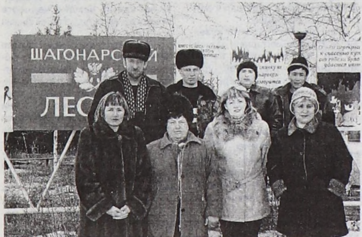
Арга-арыг ажыл-агыйының бөлүк ажылчынары.