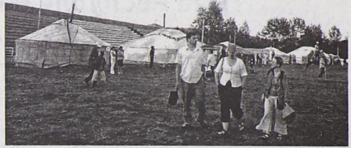
Бодап тур мен. Саян дагларының эдээнде алдын хүн дег хүн-эдерлерни көргөш, бистиң Иссык-Куль шынаазында кызыл мактар дораан сагыжымга кирип келди. Бистиң чоннарывыс база дөмей – ажил-ишти, хөй ажи-төлдүг,