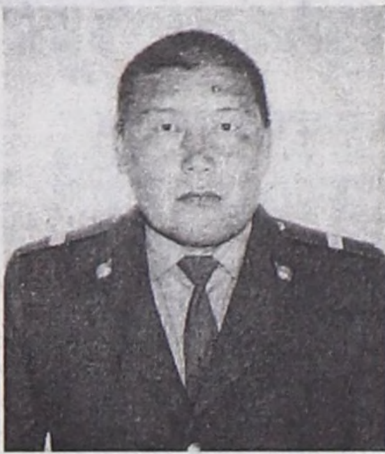
Елизаветазы ачазынга улуу-биле чоргаарланыр.

Соңгу Кавказка дайынның эң-не чидиг үелеринде 5 удаа киржип, Ада-чурттуң мурнунга ыдыктыг хүлээлгезин күүсеткен. Ынчалза-даа сөөлгү сургакчылаашкын үезинде, 5 чыл мурнунда, июнь 22-ниң хүнүндө, Грозный хоорайга «Самбажык», «Тыва» деп бижиктерлиг «Урал» автомашиназынга дайынчылар сөөртүп чорда, ону