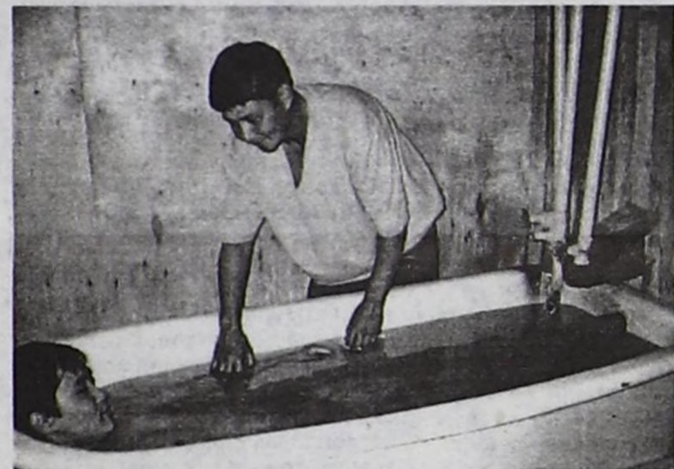
Эмчи сестразы Айдың Кирлик-Кара.