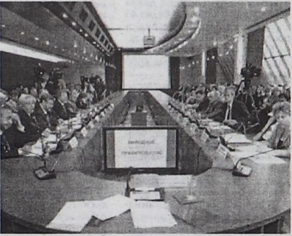
Москвада Улусчу чазактың хуралы.

сумкаларын үлээр бис. Оон ыңай чамдык кырганнар бажыңнарынга болгаш бичии уруглар азырап эмнээр төптөргө телевизорлар болгаш амыдыралга херек техниктиг эт-септи уледивис.