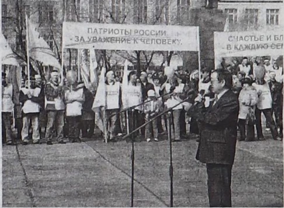
Патриоттар май 1-де.