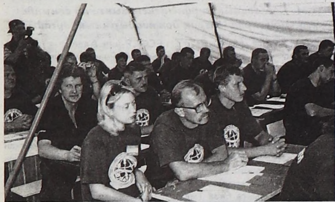
конференциязы болуп эрткен. Организацияның Дээди чөвү-Конференцияның киржикчилери делинге 16 кижиге сонгуттурган.

ону тургузары дээш чангыс үн-биле бадылааш, Россияның Онза байдалдар яамызының сайыдының бирги оралакчызы Юрий Воробьевту Россияның камгалакчылар эвилелиниң удуртукчузунга сонгаан.