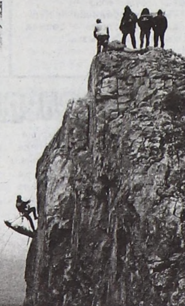
зының бир демниг ажилдап турарын көрүп турдуvus. (Уланчызы 2-ги арында).