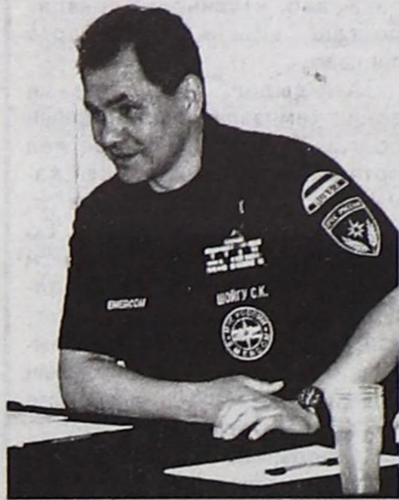
Конференцияның мандат комиссиязының дыңнатканы-биле алырга, Россияның камгалакчылар эвилелиниң 53 регионнар организациялары федерацияның субъектилеринде тургустунган болуп турар.