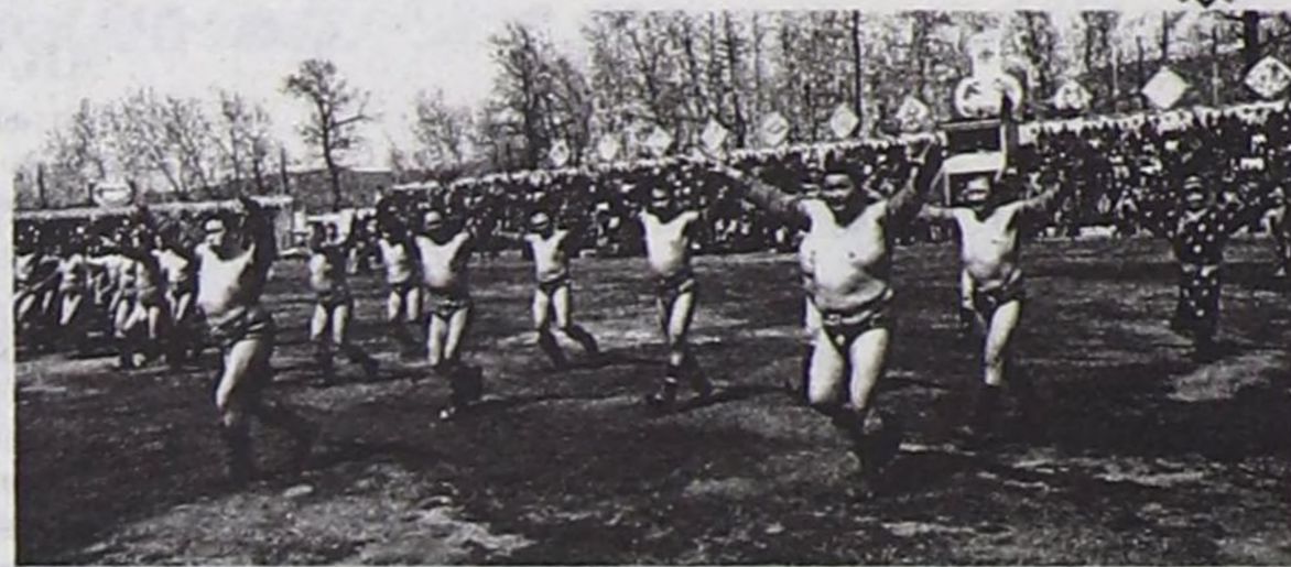
ниениң төлээлери, Моол, Чехословакиядан безин даштыкы журналистер келген турган. «Хүреш»

Ол мөгелерниң соонда Арзылаң Баа-Хөө, Арзылаң Хөвендей суглар тыттып келгеннер. Тываның шын-на Арзылаңнары — Күдерек биле олар. Арзылаң Хөвендей 60 чылдарга чедир чурттаан, 80 харлыг тургаш, күдээзи мөге Мартыгырның чарып чадаан токпактарын чара шааптар турган. Мартыгыр 1938-39 чылдарда Нарын алдын уургайыңга ажылдап чорааш, Ак-Эрик күдээзи апарган. Узун, бе-