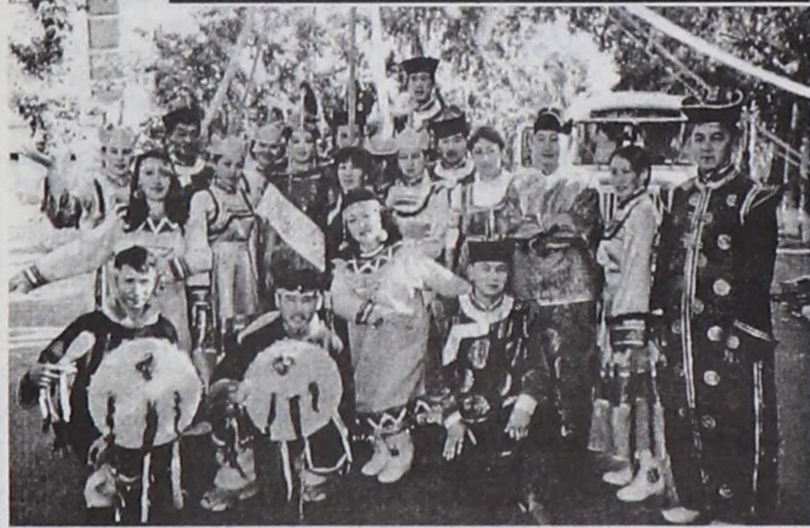
Тоора-Хем клувунуң ажылдакчылары.

клубтарының ажылының угланышкыннары аңгы-аңгы болуп турар, ол дээрге эстетиктиг мөзүшүнар, культурлуг, патриотчу кижизидилге, чон-биле ажил, арагалаашкына, таакпылаашкына удур хемчеглер дээш, оондаа еске.