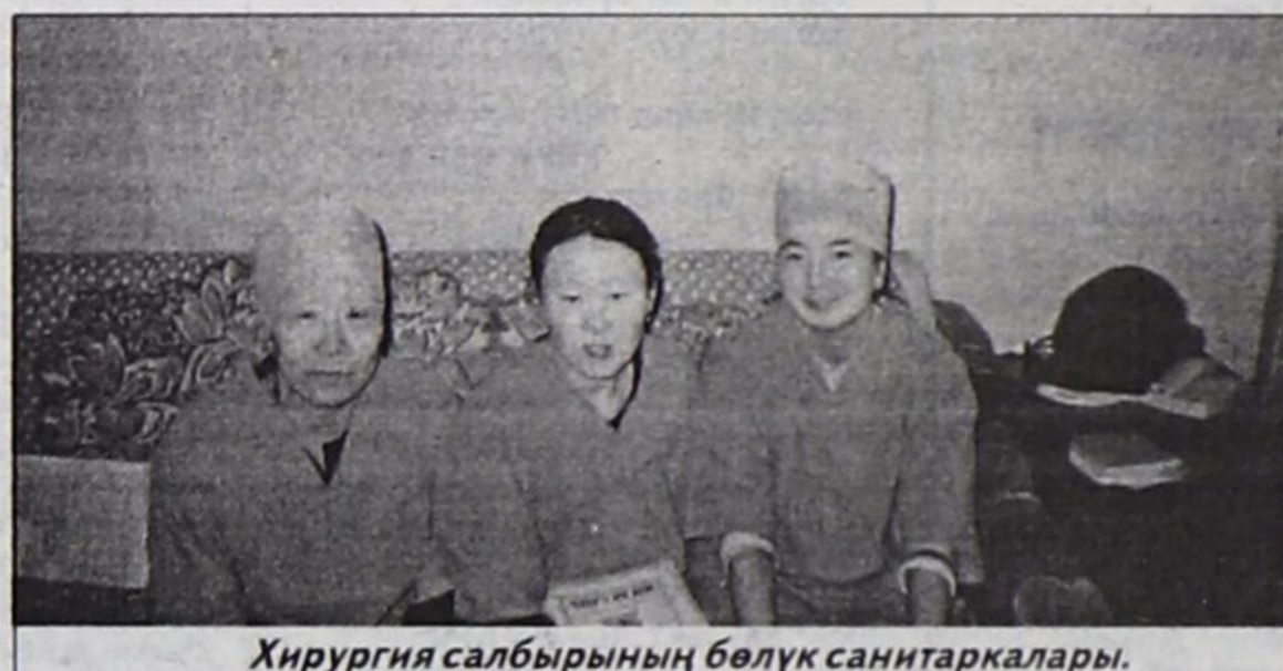
Хирургия салбырының бөлүк санитаркалары.

ты эмнелгезиниң хирургия салбырынга эккелди. Мени ол-ла дораан чыттырып алганнар. Хайгааралга бир хондум. Эртенінде эмчилер келгеш, ишти-баарымны тудуп, хынап көрдү. Оон хирург эмчи Орлан Эрес-оолович Кыргыз палатаже кирип келгеш, хынап көргөш, кезишкн кылырын чугаа-