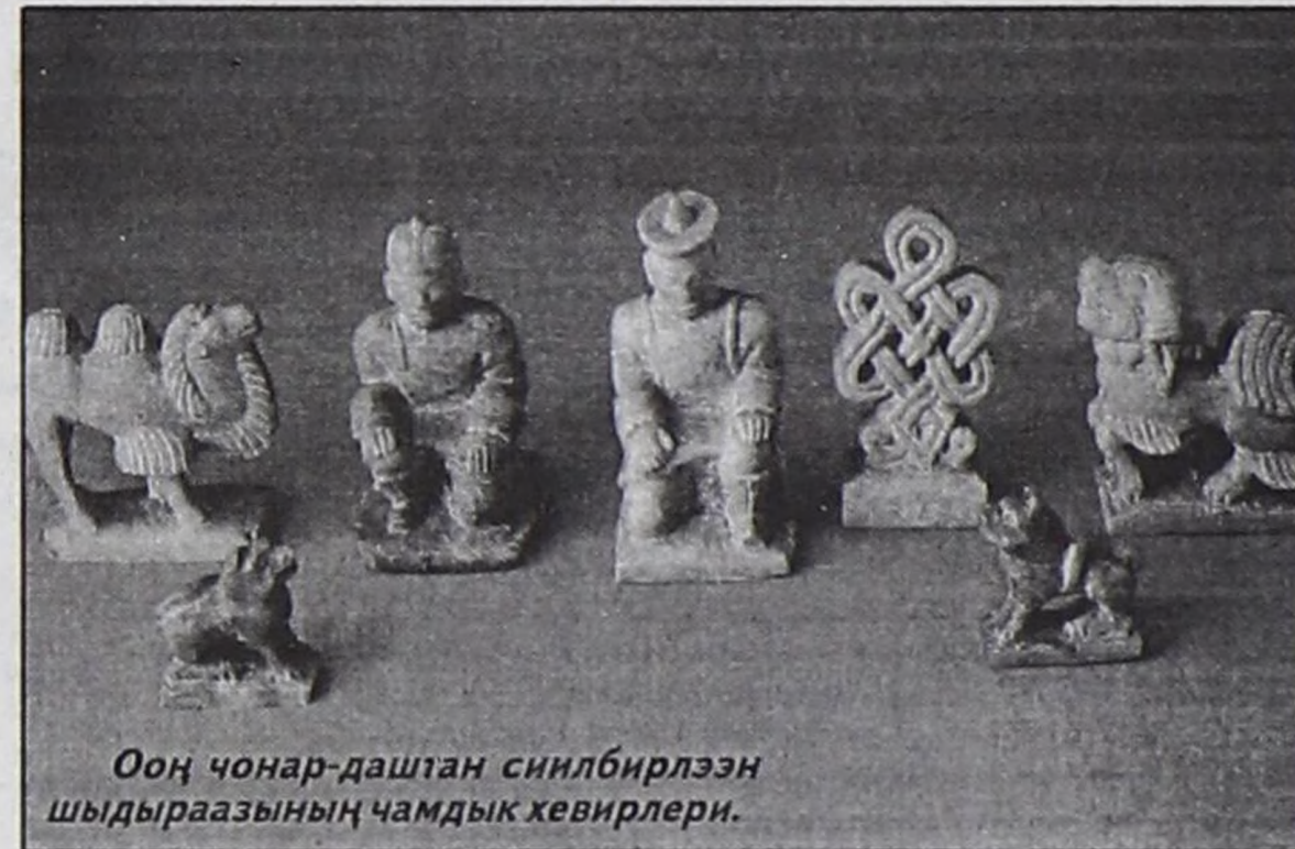
Ооң чонар-даштан силбирлээн шыдырааның чамдык хевирлери.