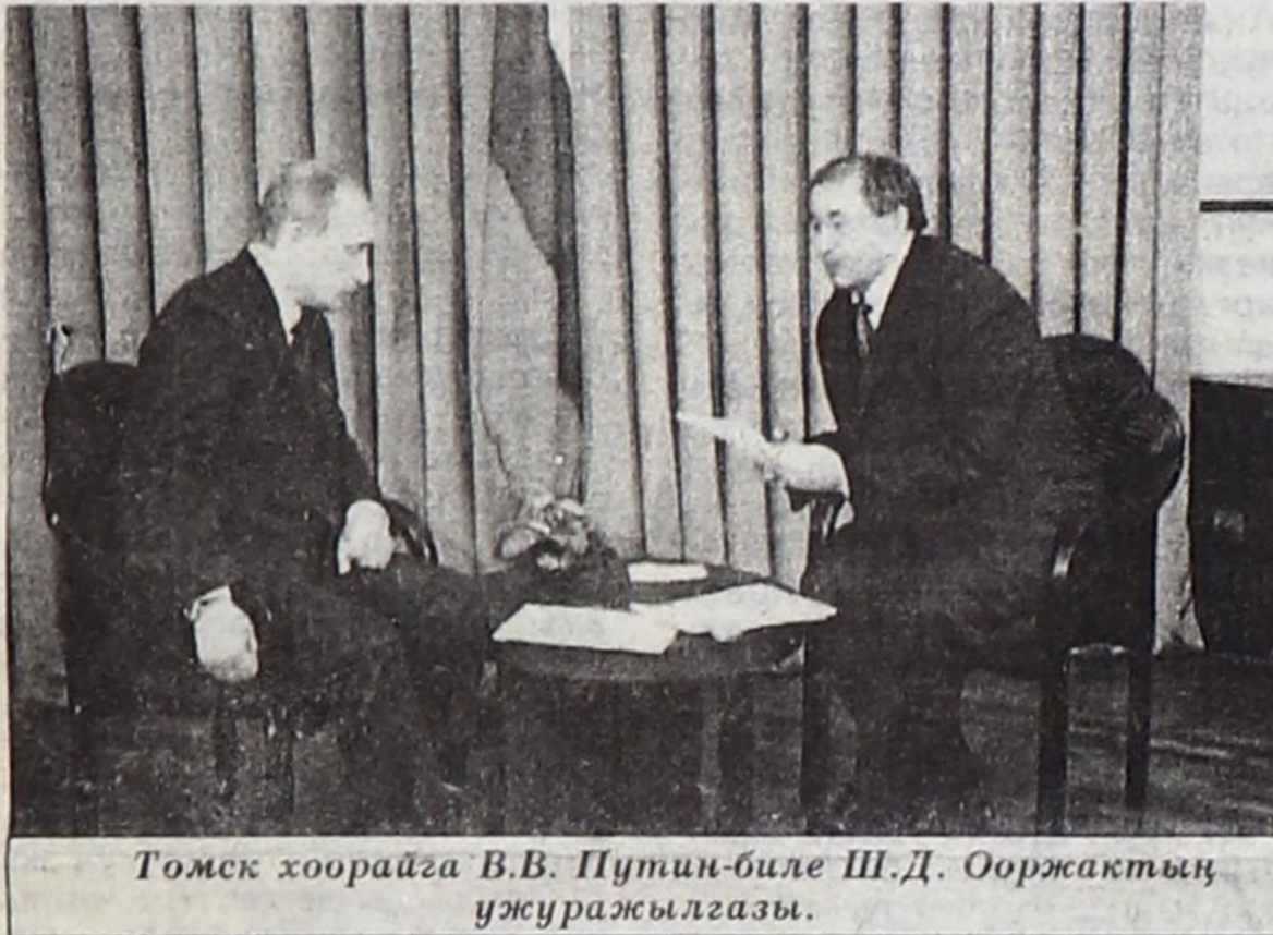
Томск хоорайга В.В. Путин-биле Ш.Д. Ооржактың ужуражылгазы.

Сибирьның социал-экономиказын хөгжүдөр айтырылгарга турскааткан «Сибирь дугуржулгазы» девискээр ассоциациязының хуралы Новосибирск хоорайга болуп эрткен. Россия Федерациязының Президентизи В.В.Путин орта олуршкан. Владимир Путин Томск хоорайга Сибирь девискээрлериниң губернаторлары-биле ужурашкан. Бо хемчеглерге Тыва Республиканың Чазак Даргазы киржи чорааш, апрель 27-де ээп чанып келген. Шериг-оол Дизиживичини Тыва Республиканың Чазак кежигүннери болгаш өске-даа харысалгалыг ажылдакчылар, журналистер Кызылдың аэропортунга уткуп алган.