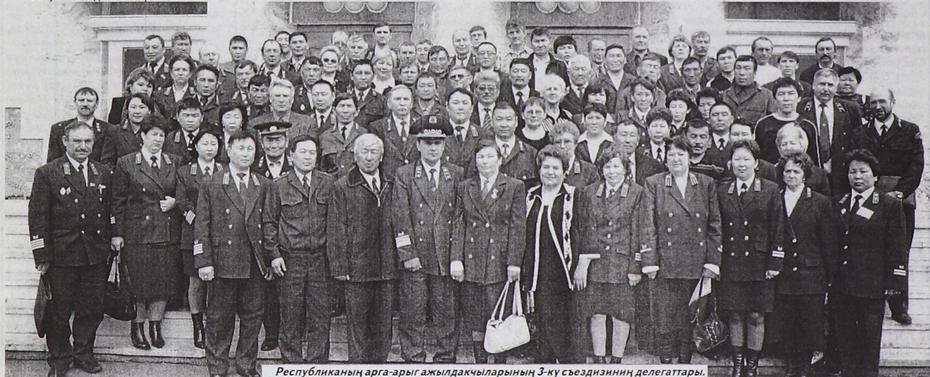
Республиканың арга-арыг ажилдакчыларының 3-кү съездизинин делегаттары.