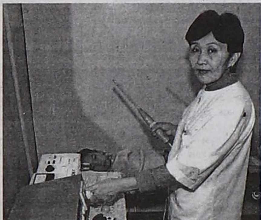
Эмчи сестразы Р.М.Тумат аарыг уругну чиңнеп тур.