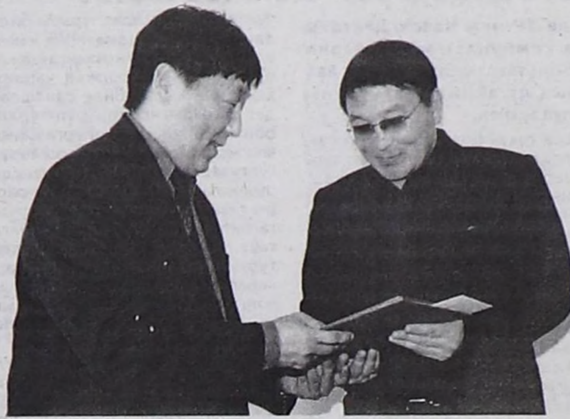
«Шын» солунуң коллективинге.

Чеди-Хөл, Бии-Хем, Өвүр, Сүт-Хөл кожууннарның ажил-амыдыралы эки чырытканы дээш, «Шын» солунуң коллективинге хүндүлүг дипломну болгаш акша шаңналын тывыскаң.