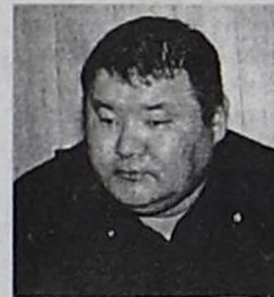
деп санаар мен.