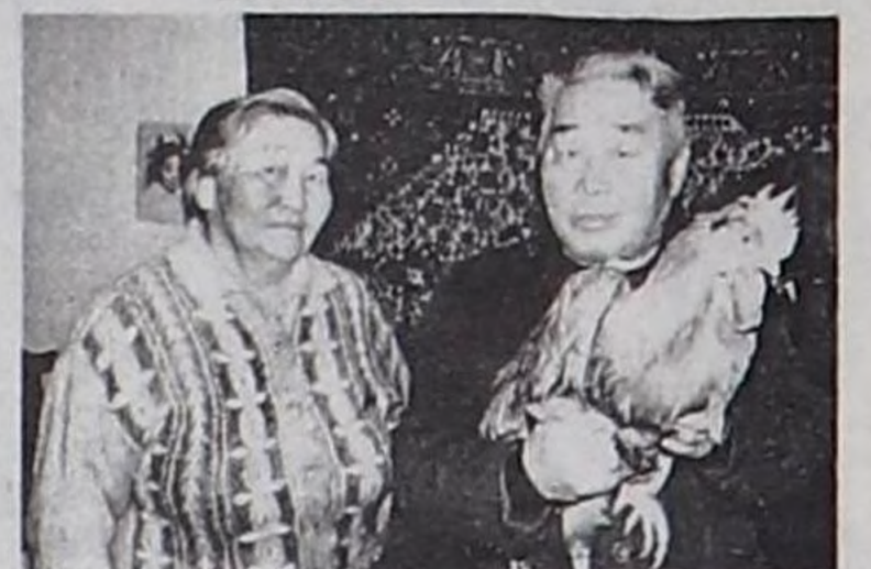
оол Түлүшович дагаалары-биле кады уткуй үнген Дагаа чылында бай-шыырак, тодуг-догаа чурттаарыңарны күзеп-тур. Чойганмаа САТ. В.БАЛЧИЙ-ООЛДУҢ тырттырган чурру.