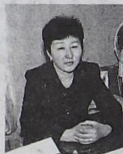
Чылда эки ажилдаарывысты күзээр-дир мен.