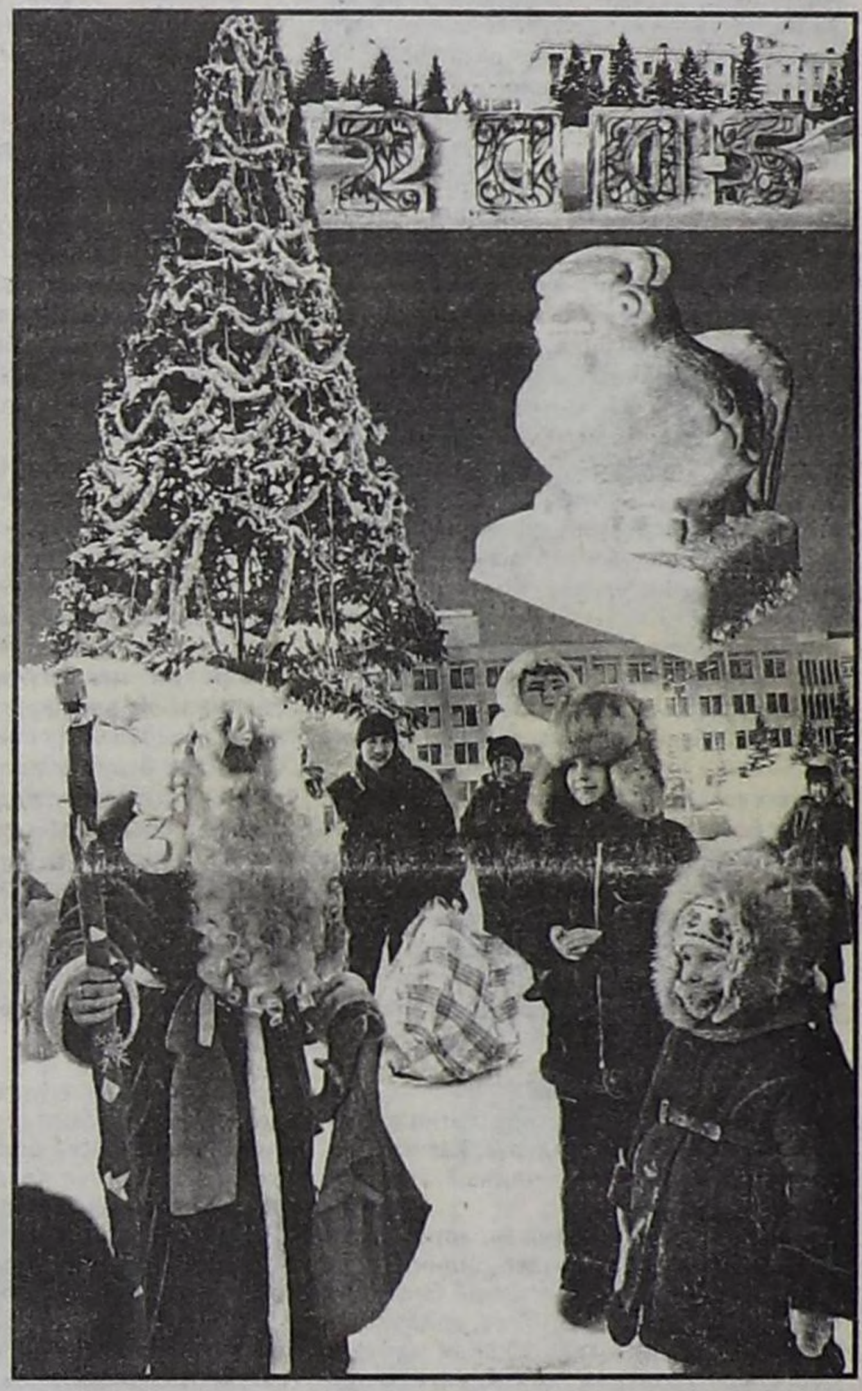
Кызыл хоорайның Төп елкасында. Василий Балчий-оолдун чуруу.