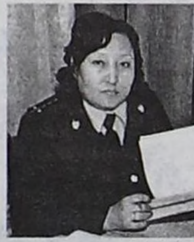
улгаттырып алыр дээр күзелдиг бүдөрүн күзээр-дир мен. Ол ышкаш чаа чылда кем-херек үүлгедишкенин эвээш болуру күзүңгү.