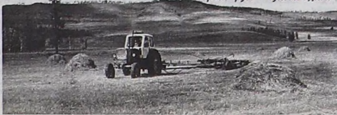
Тыргырткайнып сиген кезер Тракторум — тулган эдим.