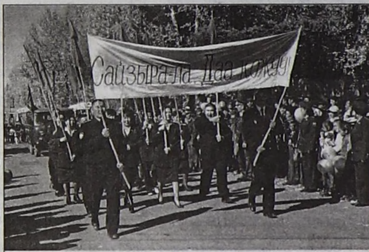
Байырлыг чыскаал үезинде.