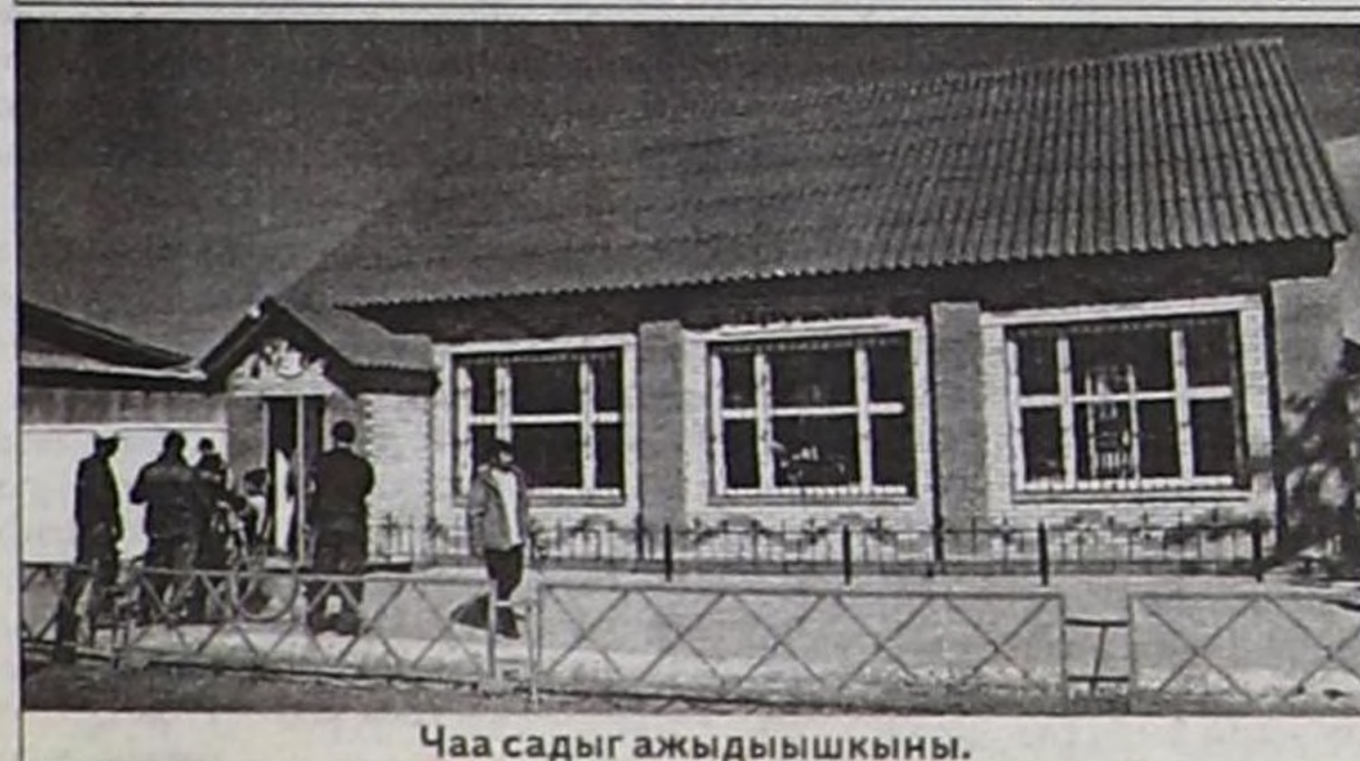
Чаа садыг ажыдышкыны.