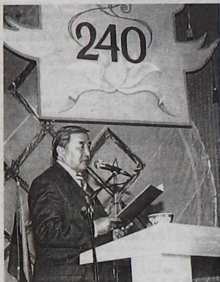
Эргим хүндүлүг чонум, ха-дуңма, хүндүлүг хоочуннар, чалаткан аалчылар!

Бөгүн бис төөгүлүг Даа кожуунуң 240 чыл оюнуң кайгамчык онза байырлалыңга киржир аас-кежиктиг болуп турар-дыр бис. Ынчангаш ооң-биле холбаштыр улуг-биче бүгү чөөн-хемчикчилерге база байырлалда киржил келген силер бүгүдөгү чүректин ханызындан изиг байырны чедирерин чөпшээрер көрүнер.