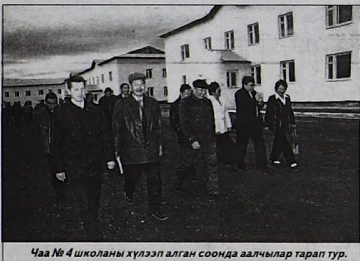
Чаа №4 школань хүлээп алган соонда аалчылар тарап тур.

Кудумчуда ол-бо шуушкан кижилерниң арын-шырайын өөрүшкү-маңай долган. Олар төрөөн кожуунунуң 240 чыл болган байырлалының эгелээрин четтикпейн манап турган. Бот дугайты Чадаана хоорайны долгандыр топтап көрүп, 240 чыл бурунгаар бо черге чүү бооп турганын сагыжымга чуруурун оралдаштым. Ынчан бо черге каш-ла каас-коя ак өглер турган чадавас. Оларның чанынга маньжур-кыдат, моол, тыва ызыгууртан нояннар чонну чагырарыңа, үндүрүг хавырарыңа эпиг болзун дээш Даа кожуунну тургускан чарлыктарны хөй чон мурнунга номчуп турган чадавас. Ол чорук дыкка улуг девискээрин чонун каттыштырган, административтиг төптү тургускан депшигелиг хемчег болганы чугаажок.