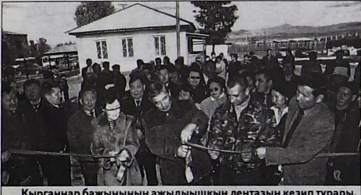
Кырганнар бажыңның ажыдышкын лентазын кезип турары.

Дараазында уругларның спорт школазының коллективи мөге Долаан Доржукайның удуртулгазы-биле чоруп орган. Ук школада янзы-бүрү спортчу хевирлерни 32 тренер башкыларның ажилдап ту-