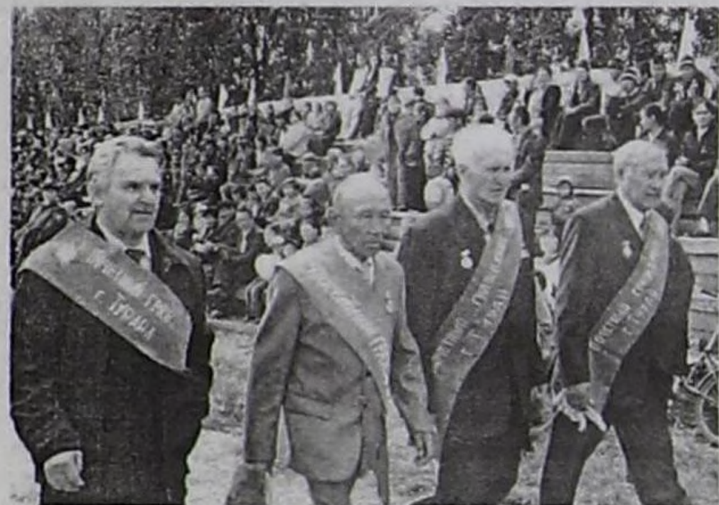
Хоорайның хүндүлүг хоочуннары.

лиг үнүп турганы. Хүрежир дээш келген кижини ыяап содак-шудактыг болур болгай.