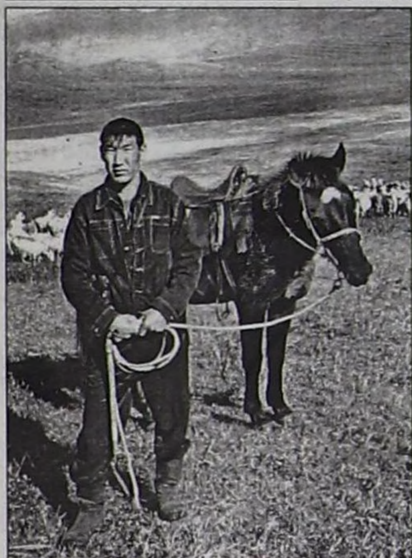
Студент Айдыс хой кадарып чор.

тарып турган хову ортузунда тараажылар бригадазы турган черде тургустунуп тыптып келген. Ону долгандыр ховулардан шаанда тараажылар 1га черден 60 центнер дүжүттү ап, чүгле Тывага эвес, бүдүн ССРЭ-ге диңмиреп турган. Ол ховудан алдынган дүжүттүн дээжини Москвага Улус ажил-