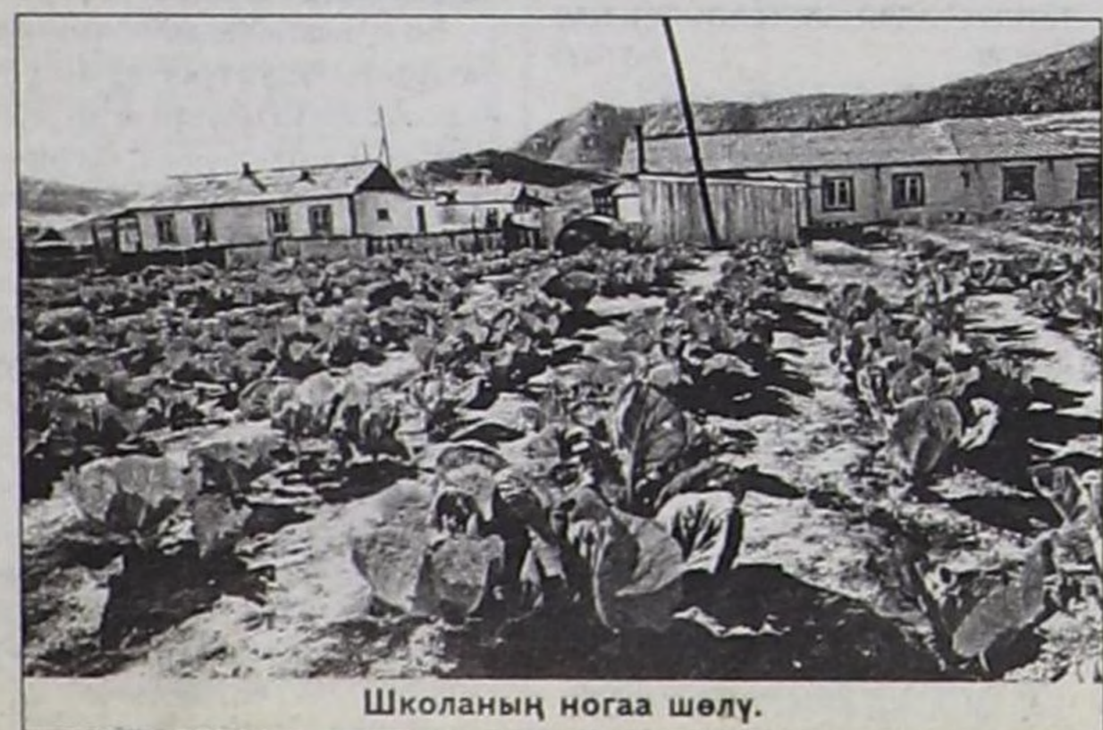
Школаның ногаа шөлү.

Эге школага баштай 40 хире өөреникчи өөренип турган болза, 9 чыл школазы апарганда өөреникчилер саны көвүдзэн. Бо хүн-