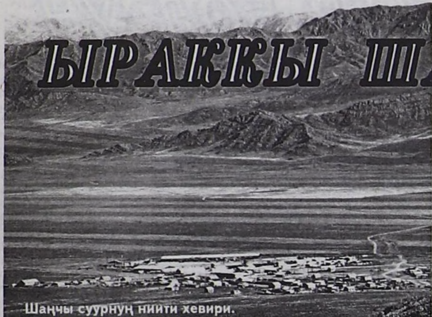
Шаңчы суурнуң ниити хевири.

Чаа-Хөлдүн Шаңчы – республикада эң озалааш суурларның бирээзи. Ук суур шаанда сайзыраңгай ССРЭ үезинде хөй тараа