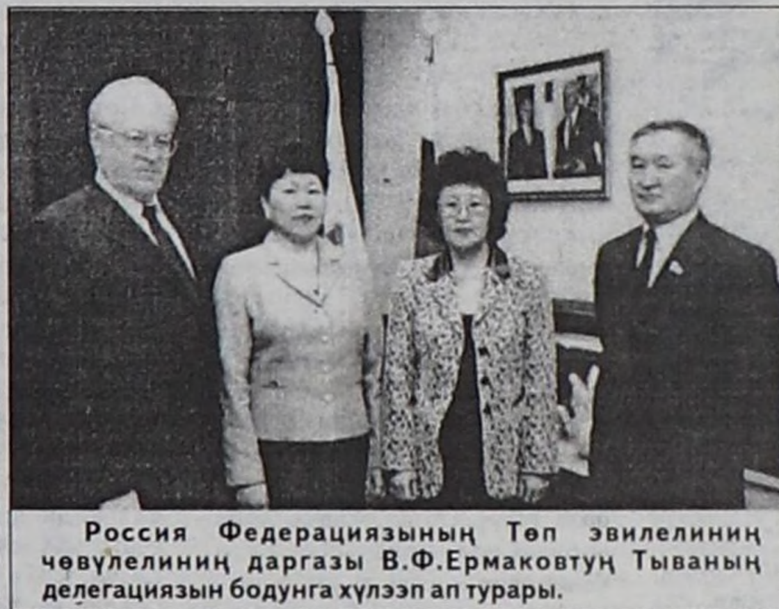
Россия Федерациязының Төп эвилелиниң чөвүлелиниң даргазы В.Ф.Ермаковтуң Тываның делегациязын бодунга хүлээп ап турары.

кадарып турган дээр. «Чиңгис-Хаанниң хөөрүн кадагалап-кадарган урянхайлар (тывалар) ам-даа ол ыдыктыг черни кадарып турарлар» деп Рашид-ад-дин 1300-1310 чылдарда бижээни автор база айтып турар.