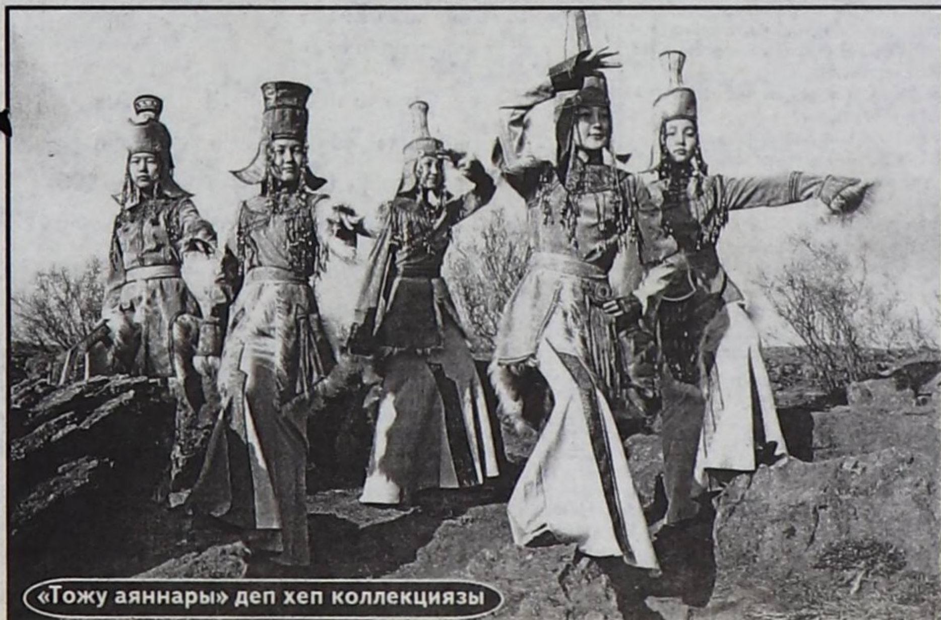
«Тожу аяннары» деп хеп коллекциязы