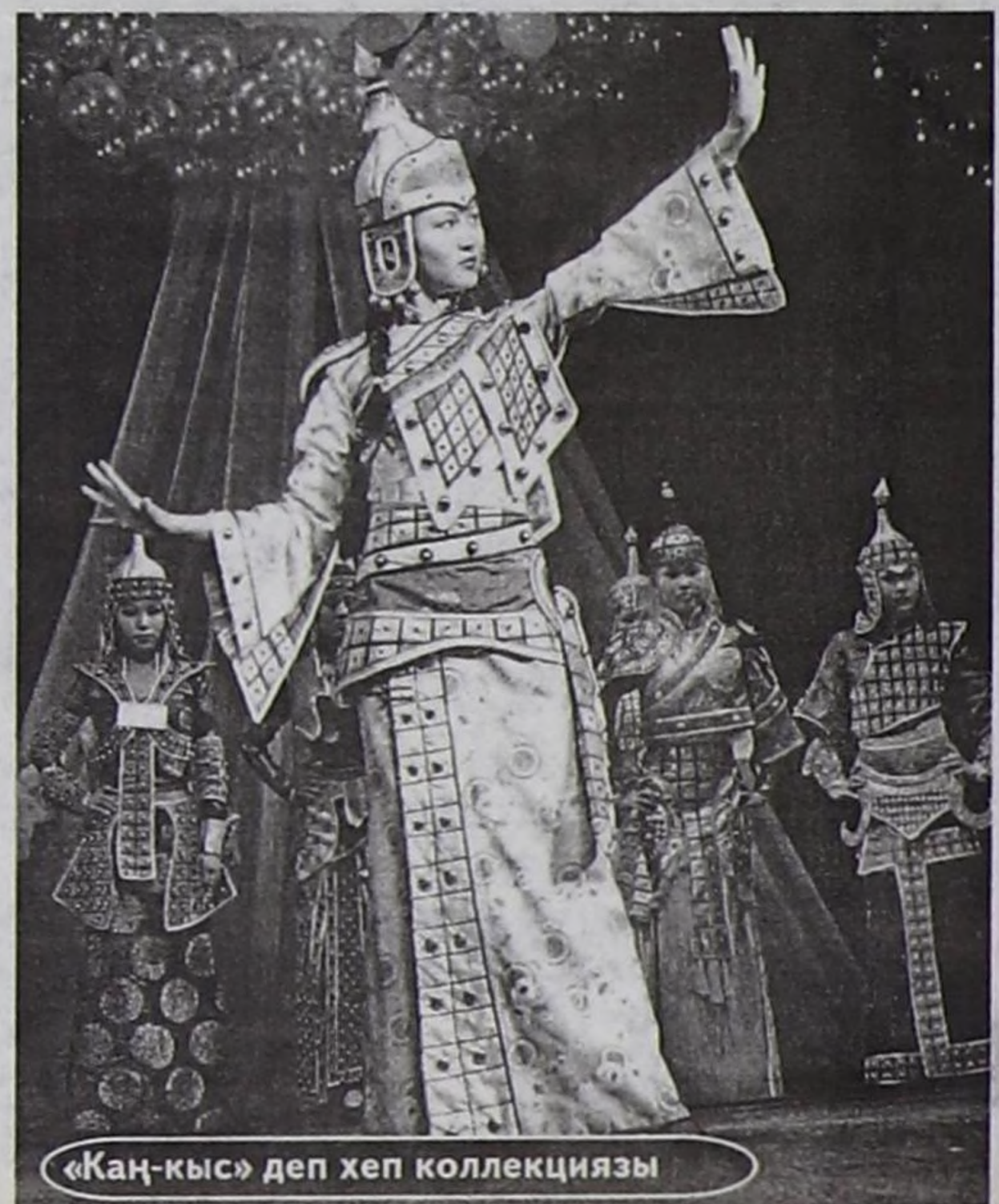
«Каң-кыс» деп хеп коллекциязы

49. Ам бир катап төрүттүнүп келген болзуңарза, кым болук-саар силер — дөмей-ле, балет-мейстер болур мен.