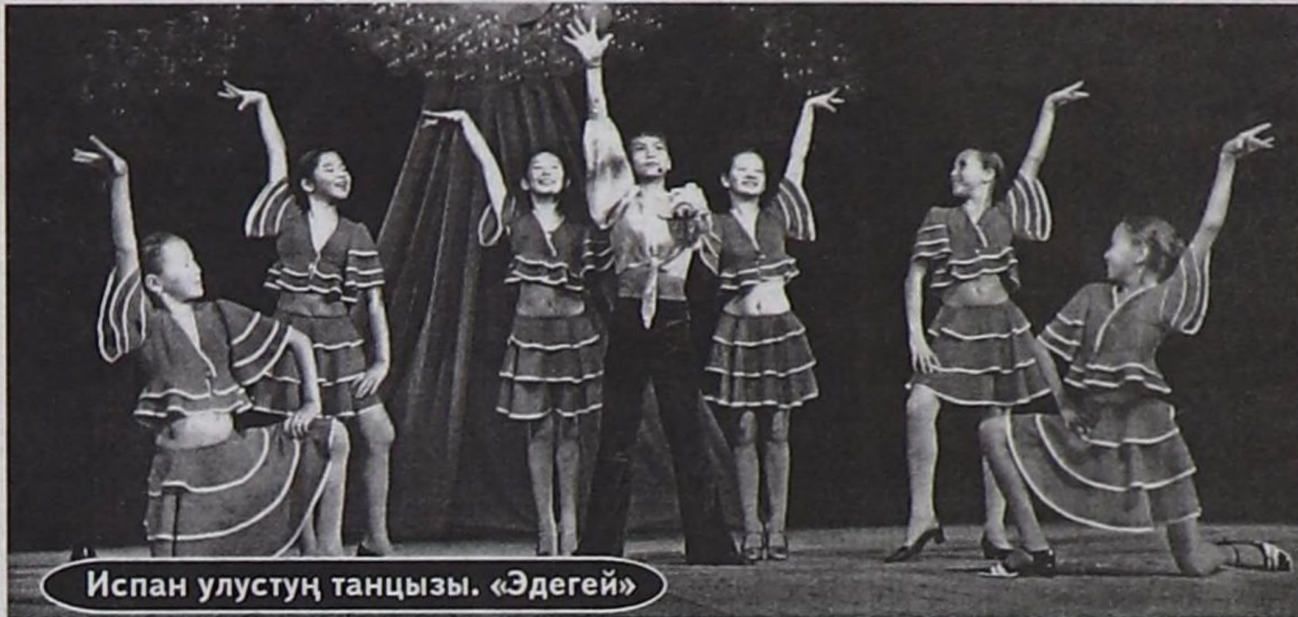
Испан улустуң танцызы. «Эдегей»

ларыңар (театралдыг көргү-зүглер ши, кино) — Акира Куросава.