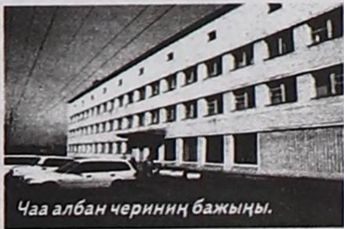
Чаа албан чериниң бажыңы.