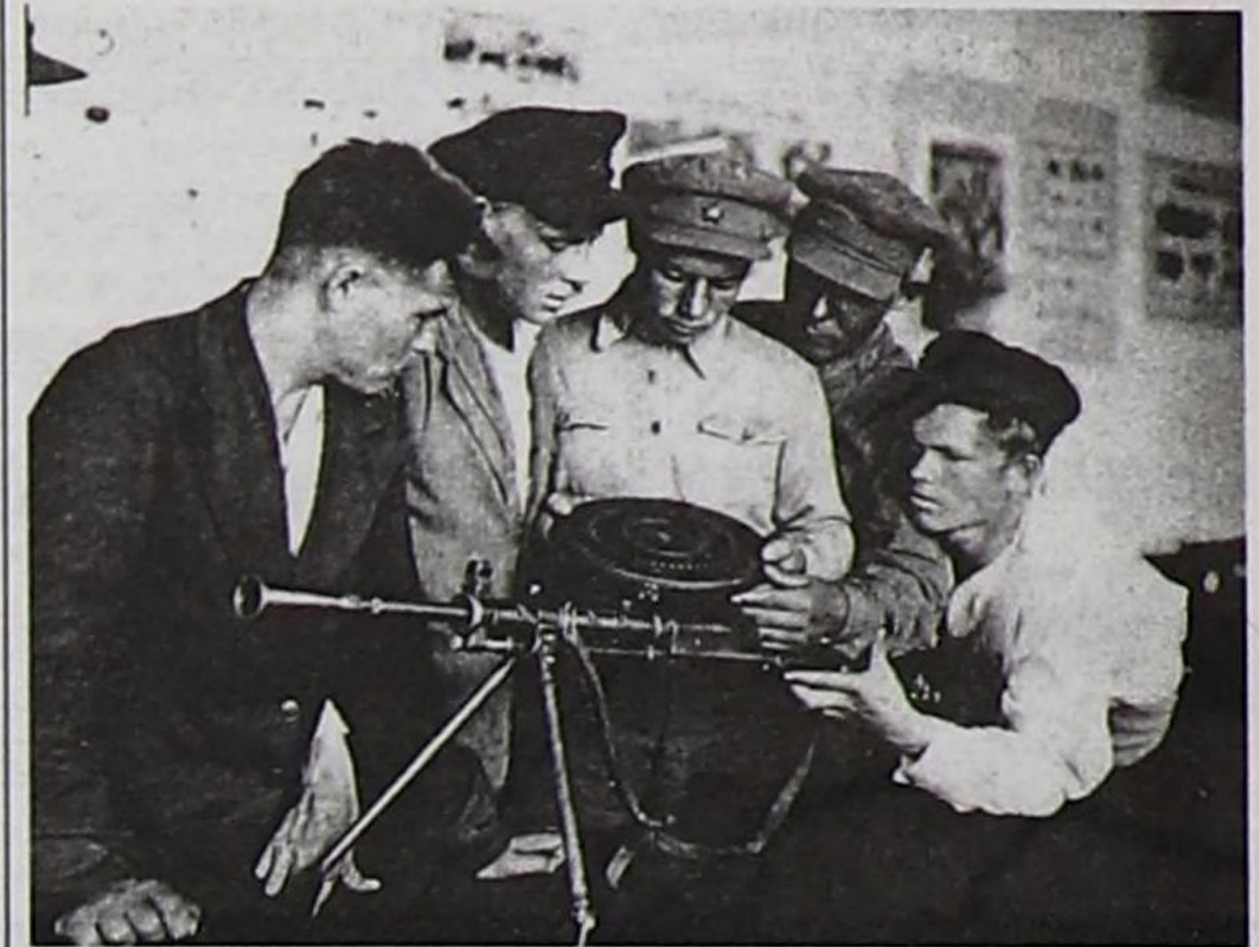
Тыва чурттуг эки турачыларның пулемет тургузуун өөренип турары.

(Чуруктарны музейниң фондузундан В.Балчый-оол хоолгалап тырттырган).