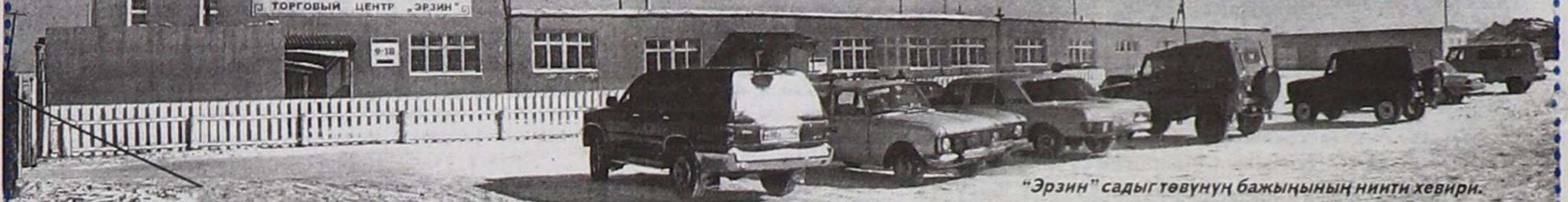
"Эрзин" садыг төвүнүн бажыңының ниити хевир.

Эрзин кожууннун Эрзин суурда чаа садыг төвү бо чылдың эгезинде ажиттыңан. Бистер орта чедип, ооң ажил-чорудулгазы-биле таныштывыс.