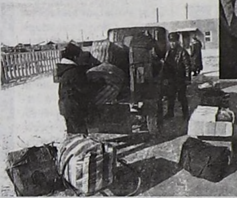
Сайгарлыкчылар бараанын сөөртүп эккелген.