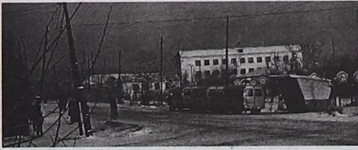
1937 чылдан бээр Кызыл-Мажалык суурнуң хоочун чурттакчызы кижини мен. Ынчангы суурну бөгүнгү Кызыл-Мажалыкка канчап деңээр боор.

Суур бо хүннерге чедир кайгамчык сайзыраан. Үжен чылдар үезинде аңаа чүгле үш-ле: Октябрь, Культура, Малчын деп кудумчулар турган. Оларга албан черлериниң бажыңнары, школа, эмнелге, милиция, күрүне банкызы, коржаа складтары колдап турган. Албан-хаакчыттар, ажылчыннар, чурттакчылар боттарының өглеринге чурттап турган. Ону ынчан өг хоорай деп адап болур турган. Амгы Кызыл-Мажалык аажок улгадып, үстүү ужу "Барлык" ажыл-агый-биле тутчу берген, алдыы талазы Көп-Кежигде чеде берген. Суурда ийи аал чурттаар, үш-үш өрээлдиг, делгем, чырык бажыңнар колдаан. Тергиин чараш ийи каът Культура ордузу ырактан-на көстүп турар.