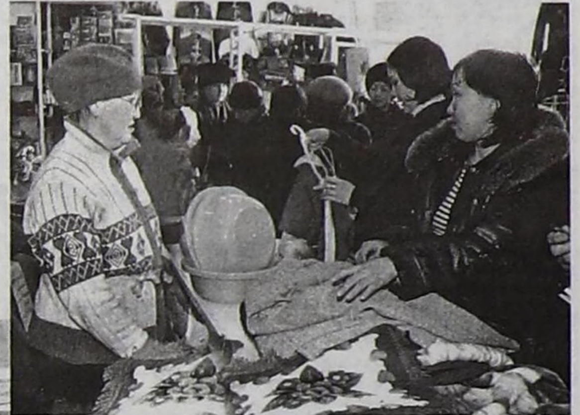
Садыг төвүнүн залында садып алыкчылар.

бюджетинче киирер, оон аңгыда үндүрүлгелерни сайгарлыкчылар төлээр. Ынчангаш садыг төвү кожуунга, чурттакчы чонга рынокту сайырадырыңа, акша-төгерикти ажилдап алырыңа ажык-