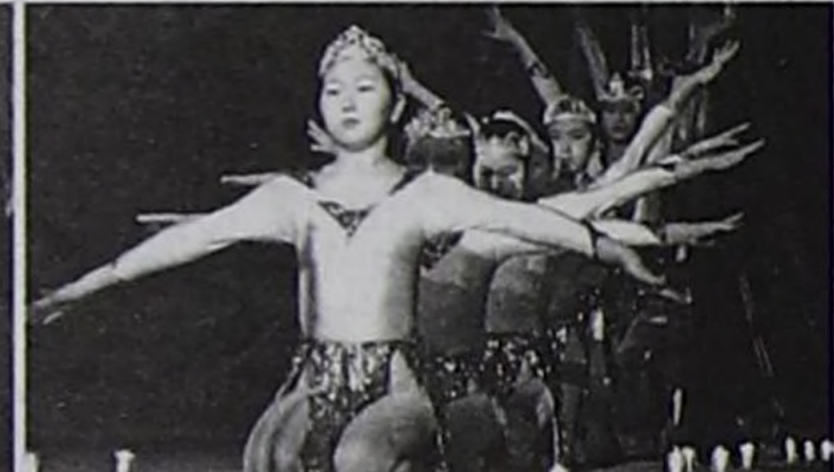
«Дамырак» бөлүү. «Будданың самы».