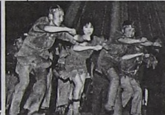
«Эгил, эжим, эгил!» деп шинден үзүндү.