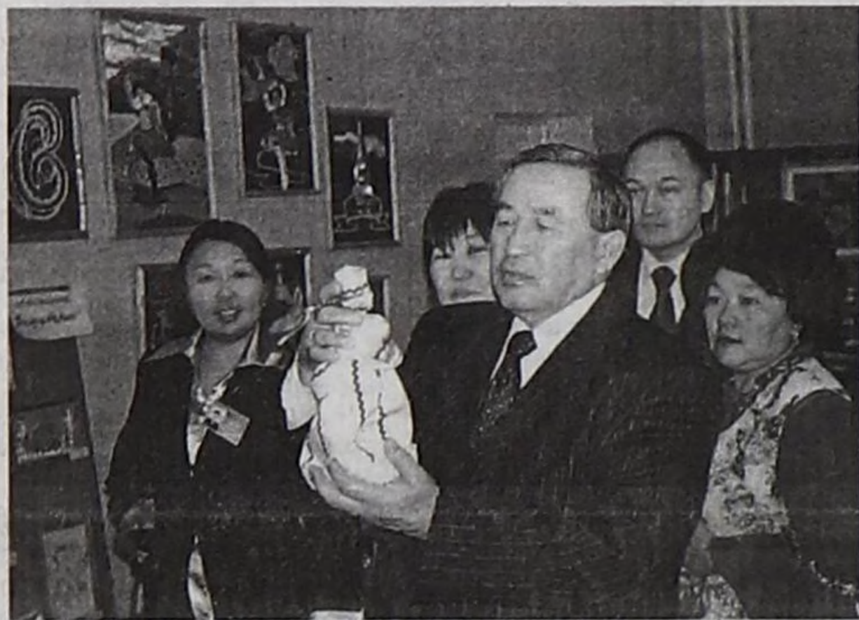
Ш.Д. Ооржактың Ак-Довурактың Культура ордузунда уругларның кылган ажылдарының делгелгезин көрүп турары.