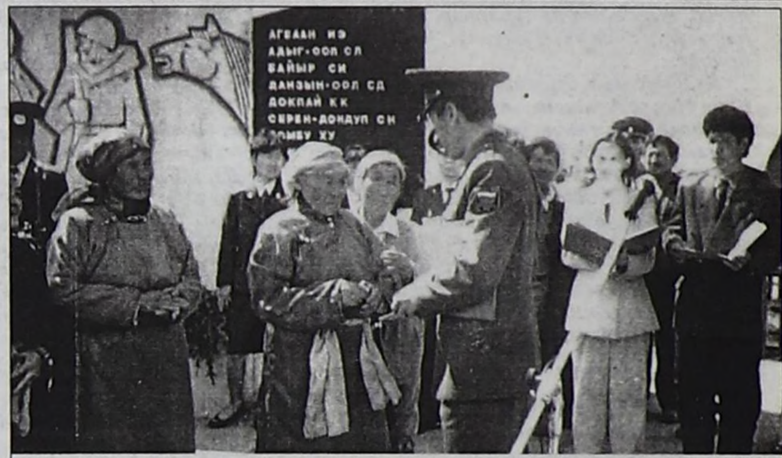
Кырган-авазыңга оглунуң орденин тыпсып турары.