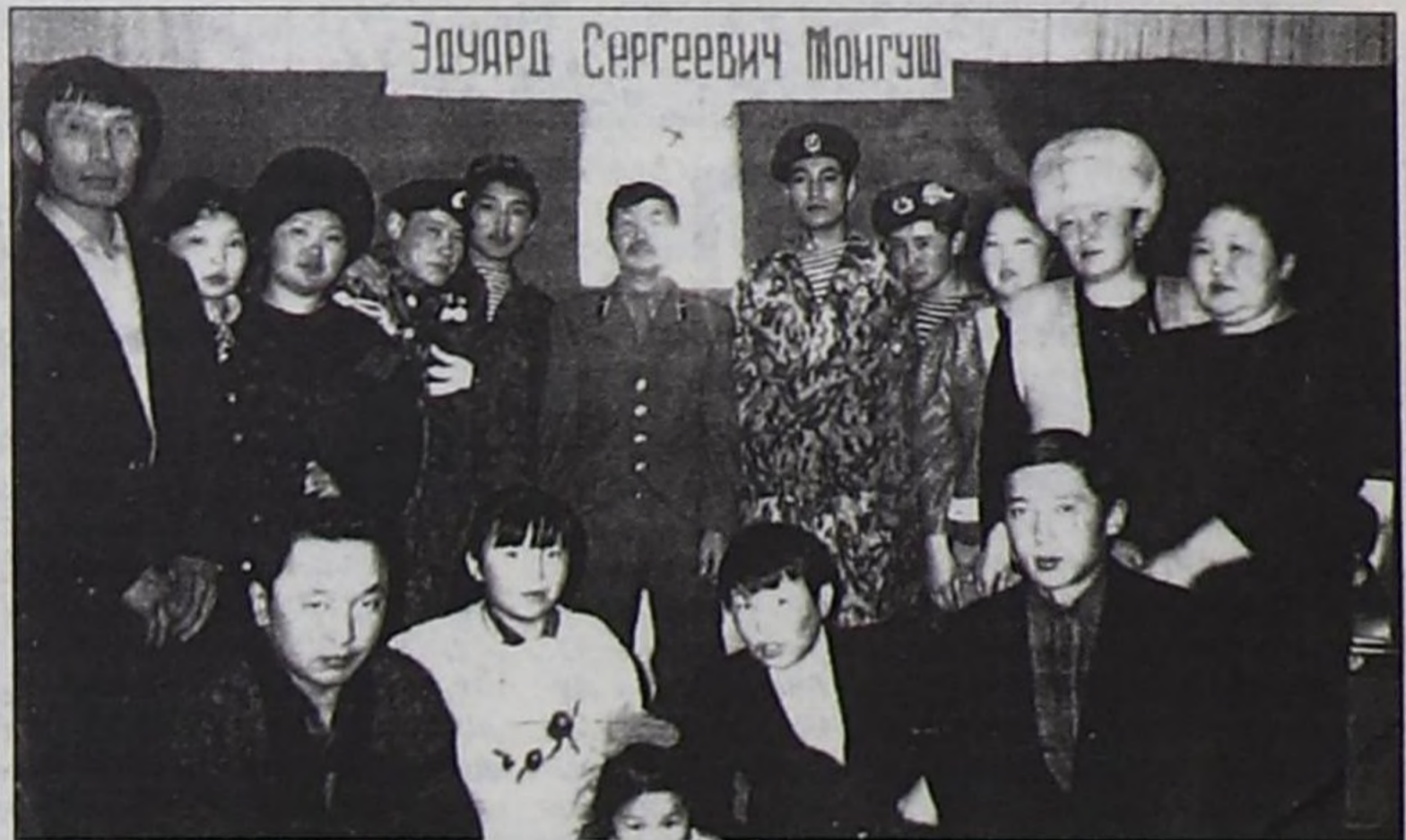
Сактышкын байырлалында: эш-өөрү, башкылары, төрөлдери; артыкы одуругнуң солагай талада эгезинде (турар) ачазы, а сөөлүндө авазы.

Ие кижилер төлү дээнде, чүнү-даа шыдажыр деп чүве бо-дур ийин. Оглу ышкаш оолдар чон аразыңга бажы бедик чорзуннар дээш, салым-чолга таварышкан хайлыг дайын оларның сеткил-сагыжын хоозурадып шыдавазын дээш, ие ажылдап, оларны