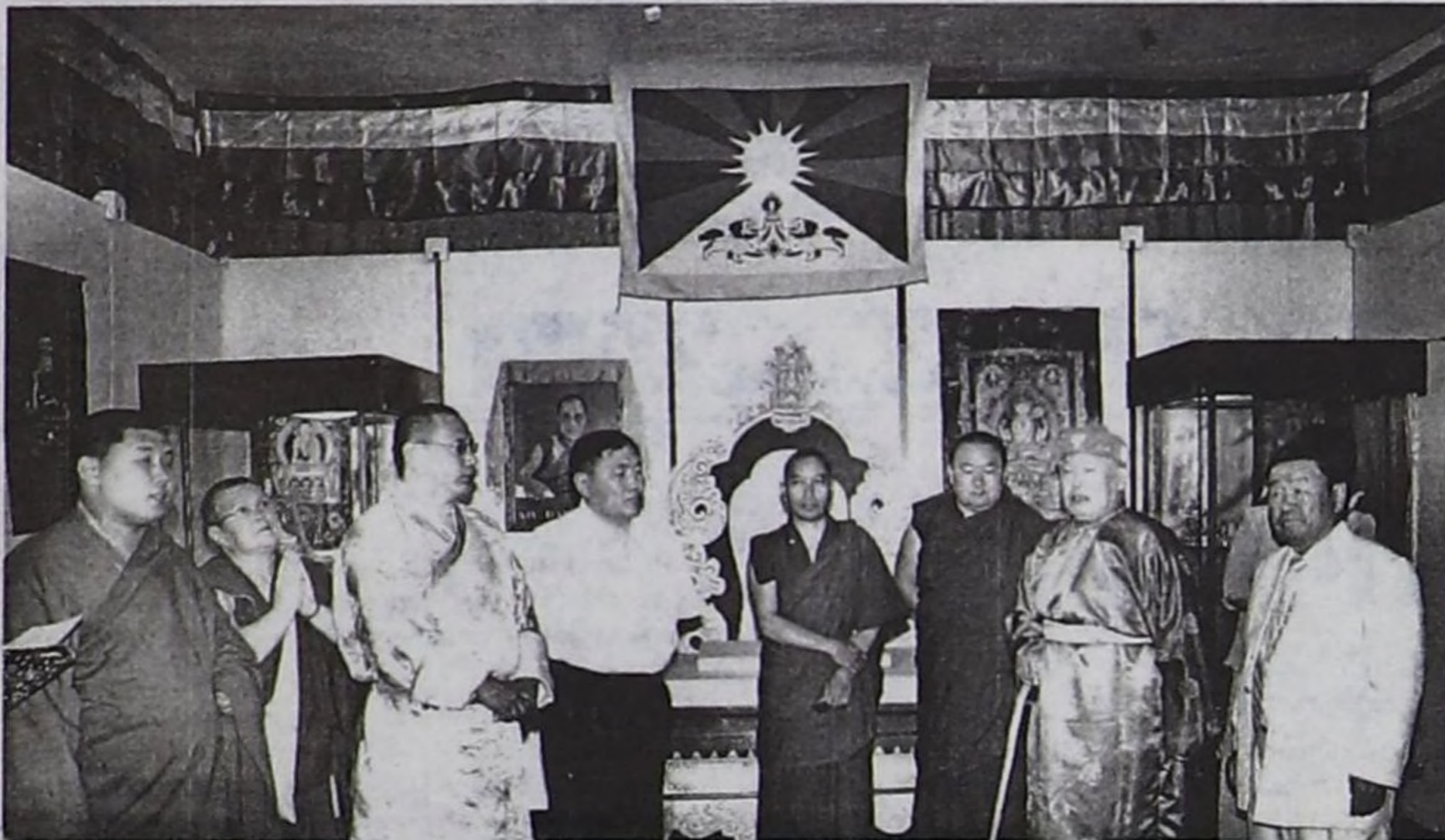
Чырыткылыг XIV Далай-Ламаның 70 харлаанынга тураскааткан делгелгениң ажыдышкынының уезинде.