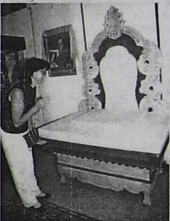
Далай-Ламаның Дүжүлгезиниң чанында чүдүкчү.

Республиканың Алдан-Маадыр аттыг чурт-шинчилел музейинге Ыдыктыг Башкы XIV Далай-Ламаның 70 харлаанынга тураскааткан делгелгениң ажыдышкыны дүүн болуп эрткен.