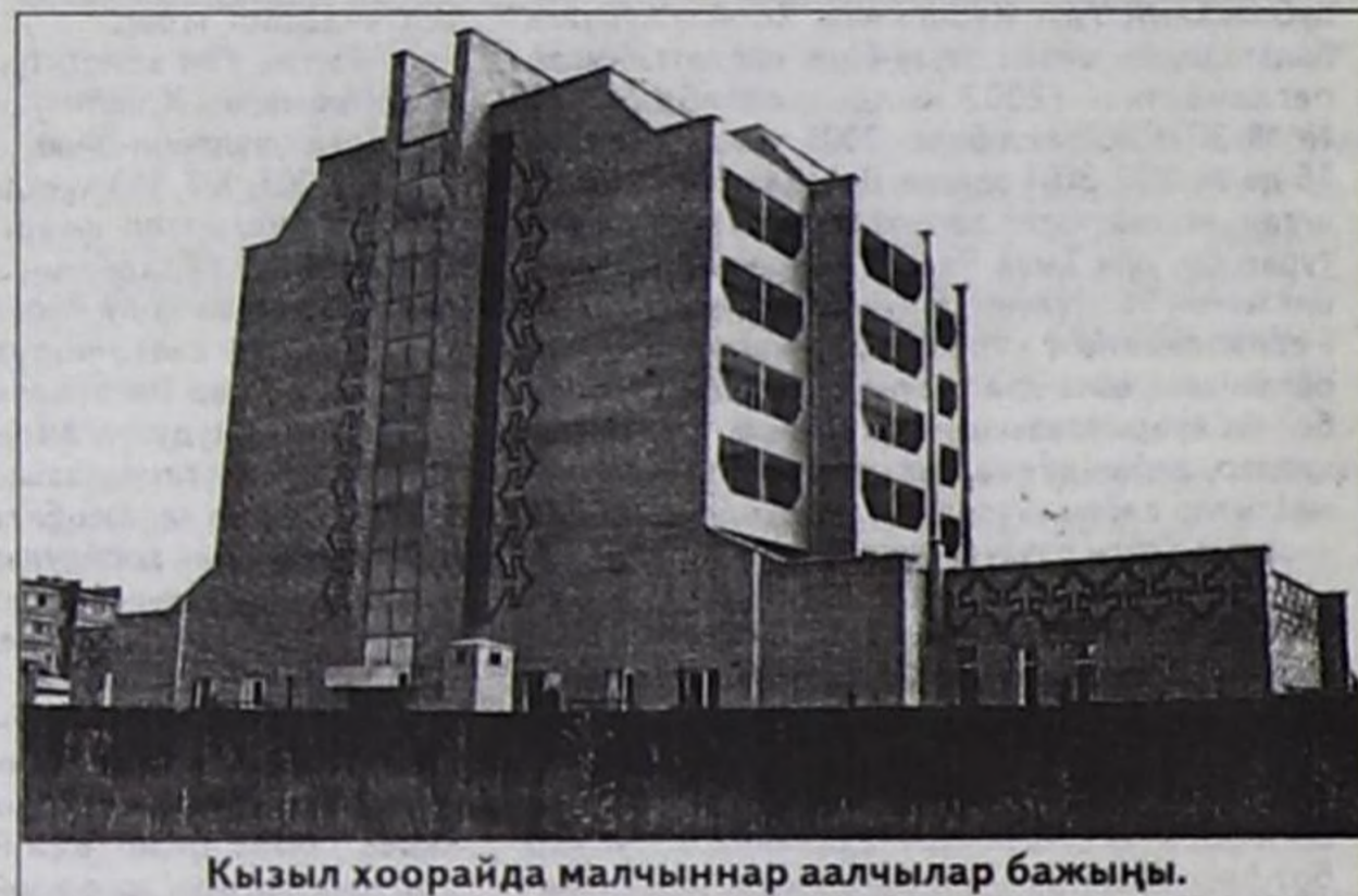
Кызыл хоорайда малчыннар аалчылар бажыңы.