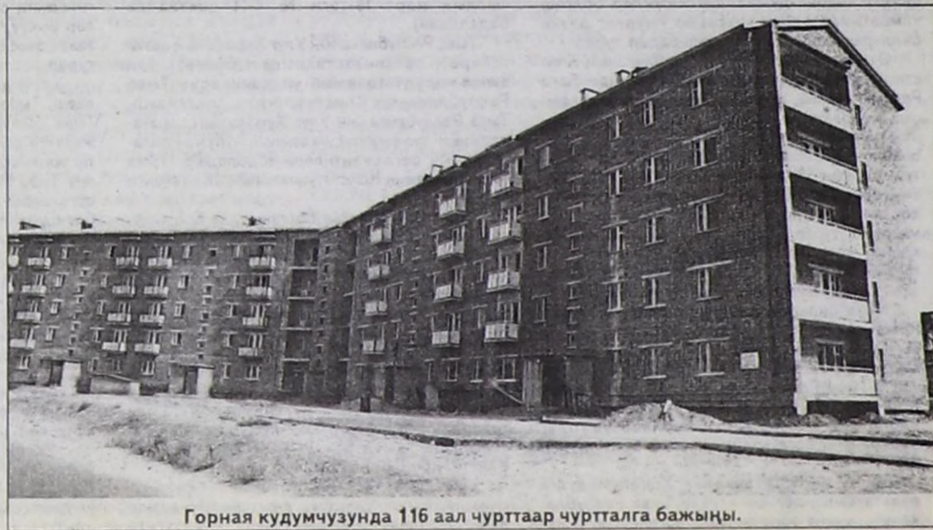
Горная кудумчузунда 116 аал чурттаар чуртталга бажыңы.