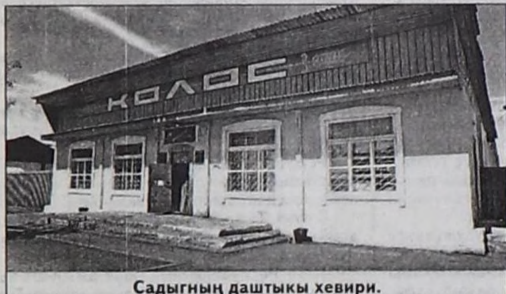
Садыгның даштыкы хевир.

Бис улуг сонургал-биле ол садыгга чеде бердивис. Иштин дургаар чоннуң амыдыралына эң эргежок барааннар делгээн, карак дун дооскан болду. Оон соонда Эрги-Барлыкка ферма эргелекчилеп, "Хемчик" совхозка эргелекчилеп, кожууннуң көдээ