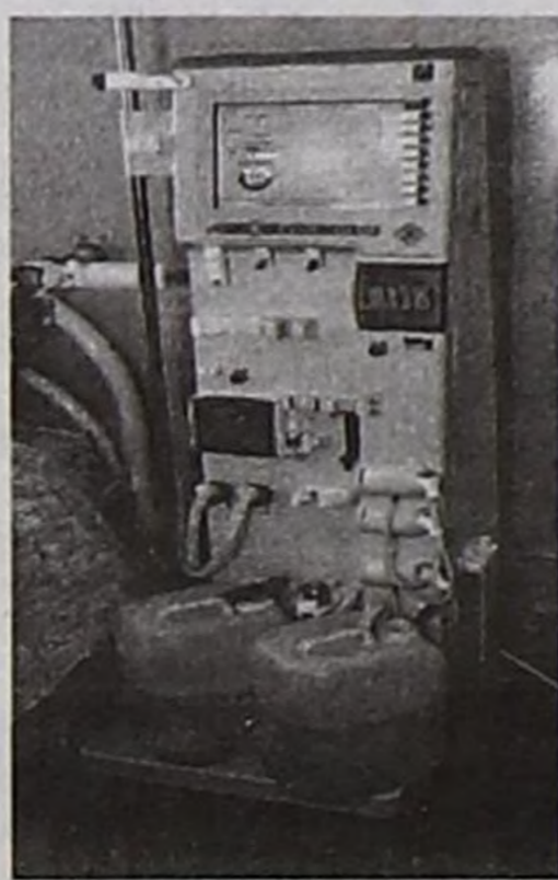
Хан арыглар чаа аппарат.

Санкт-Петербургтан инженер-техник В.Д.Сергеев эмчилерге аппараттың тургузуун тайылбырлап, ооң-биле канчаар ажылдаарын өөредип-биле Тывада ажылдап келген. Ыраккы Тываның чонунун кадыын камгалаары-биле Шагаа уткуштур улуг белекти чорудуп бергенинге №3 эмнелгениң коллективи өөрүп четтиргенин илередип турар.