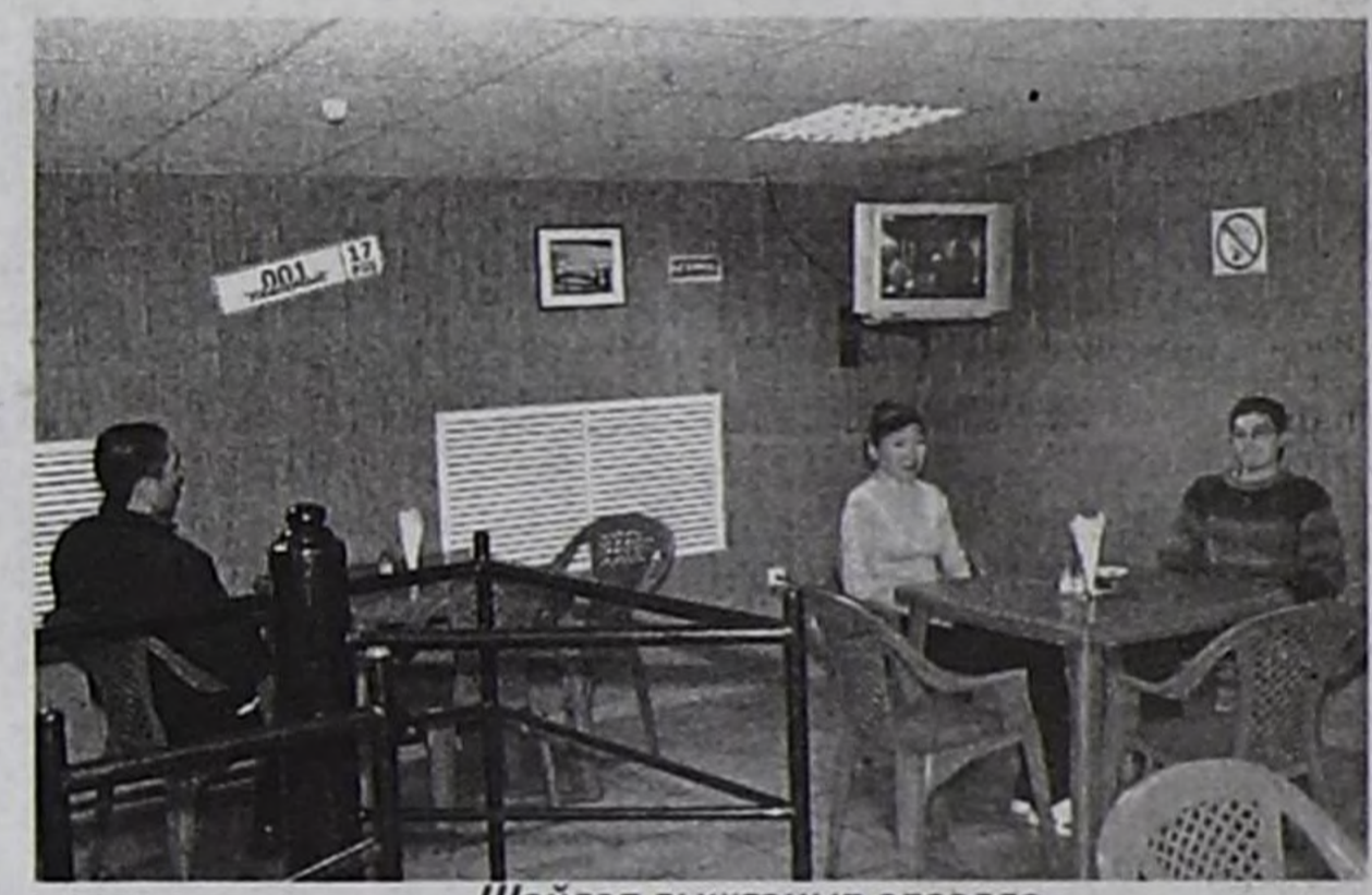
Шайлап дыштаныр өрээлдө.